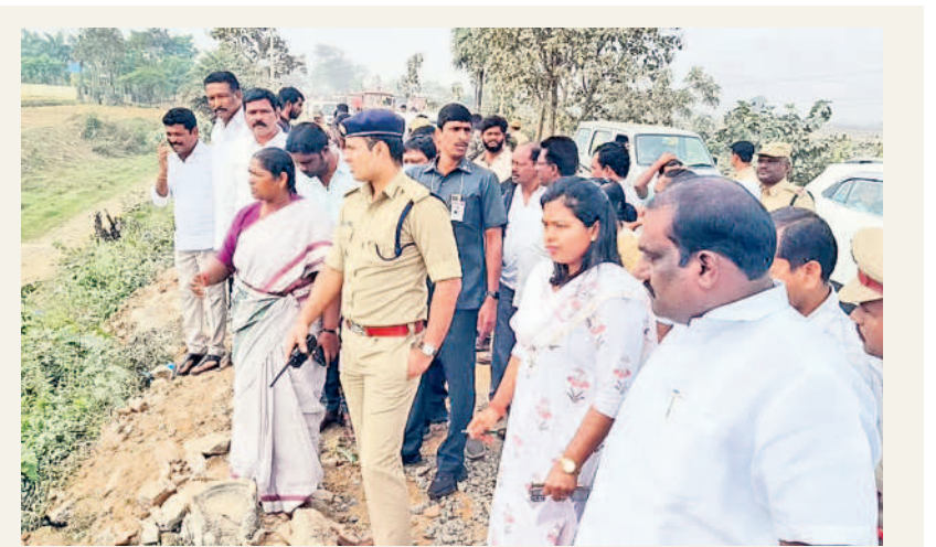
గోవిందరావుపేట: గుండ్లవారు బ్రీడ్లి వద్ద అధికారులతో మాట్లాడుతున్న మంత్రి సీతక్క