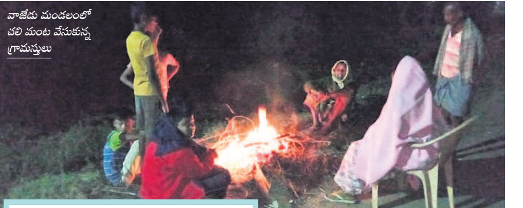
వాజేడు మండలంలో చలి మంట వేసుకున్న గ్రామస్థులు

ఉపాధ్యాయుల, అధికారుల బాధ్యతలు.. తరగతి ఉపాధ్యాయులు విద్యార్థుల బాలలు, బాలికలను తలుచుకోవాలి, విషయాల వారీగా గుర్తించి ప్రాప్యత తయారు చేయాలి. విద్యార్థుల ప్రగతిని తెలుపుతూ పాఠశాలలో నిర్వహించే వివిధ రకాల పోటీ పరీక్షలు, ఇన్స్పిర్, ఎన్ఎంఎంఎన్, ఎన్ఎంసీ, జిఎంసీ, జిఎంసీ, ఆన్లైన్ క్విజ్లు వంటి వాటి గురించి తెలియజేయాలి. విద్యార్థుల