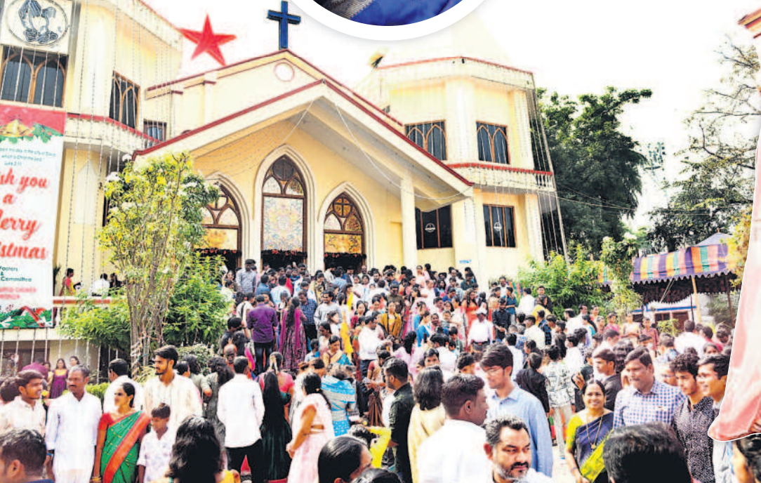
హనుమకొండ సెంటినెల్ బాప్టిస్టు చర్చిలో ప్రార్థనలు చేసేందుకు వచ్చిన క్రీస్టియన్లు