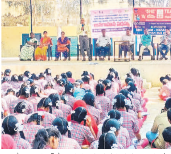
కోటిగిరి హైస్కూల్లో బాలికల అవగాహన కల్పిస్తున్న అధికారులు(ఫైల్)

నిజామాబాద్ జిల్లాలోని 353 పాఠశాలల్లో బాలికా సాధికార కమిటీలు రోజుకు రెండు మూడు చోట్ల అవగాహన సదస్సులు విద్యార్థినుల్లో చైతన్యం, ఆత్మస్థైర్యం నింపేలా కార్యక్రమాలు