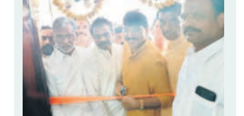
కార్యాలయాన్ని ప్రారంభిస్తున్న ఆర్కూర్ ఎమ్మెల్యే ప్రొ. రాజేశ్ రెడ్డి

ఆర్కూర్ టౌన్, డిసెంబర్ 25 : ఆర్కూర్ పట్టణంలోని ఎమ్మెల్యే క్యాంపు కార్యాలయాన్ని ఎమ్మెల్యే ప్రొ. రాజేశ్ రెడ్డి సోమవారం నాయకులు, కార్యకర్తలతో కలిసి ప్రారంభించారు. ఈ సందర్భంగా ఆయన మాట్లాడుతూ ప్రజలకు ఏమైనా సమస్యలు ఉంటే క్యాంపు కార్యాలయానికి రావాలి.. చర్యలు తీసుకోవాలి. కమిటీలను ఏర్పాటు చేస్తామని అన్నారు. అనంతరం డేజ్ మాజీ ప్రధాని అలీ బీబీ వాజేయి జయంతి సందర్భంగా ఆయన చిత్ర పూజాని పూజలు చేసి నివాళులు అర్పించారు.