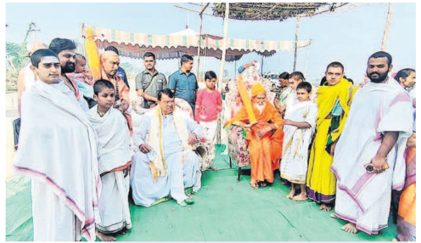
విగ్రహ ప్రతిష్ఠాపన కార్యక్రమంలో పాల్గొన్న ఎమ్మెల్యే పోచారం