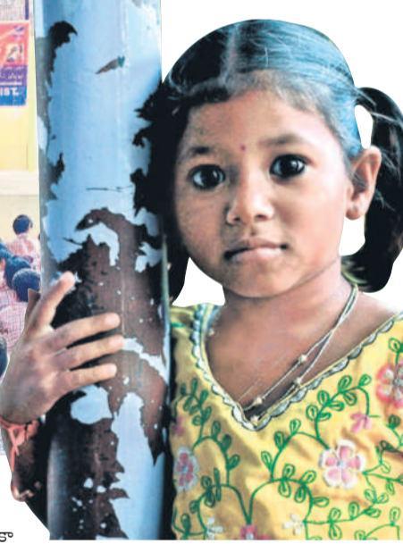
అత్తస్థైర్యం నింపేందుకు చర్యలు..

కోటిగిరి, డిసెంబర్ 25 : బాలికలకు స్వేచ్ఛ, సమానత్వం, హక్కుల గురించి తెలియజేయే కాకుండా సమాజంలో వారికి ఎదురయ్యే సమస్యలను అధిగమించడానికి ప్రభుత్వ పాఠశాలల్లో ఏర్పాటు చేసిన బాలికా సాధికార కార్యక్రమాలను మంత్రి డోహదమతుకున్నారు. బాలికల్లో చైతన్యం, ఆత్మస్థైర్యాన్ని నింపుతున్నారని. ప్రాథమిక స్థాయి నుంచే ఆడపిల్లలకు అవగాహన కార్యక్రమాలు నిర్వహిస్తున్నారు. ఈ ఏడాది తిరిగి కమిటీలు ఏర్పాటు చేయాలని విద్యాశాఖ ఆదేశాలు జారీ చేసింది. లింగ వివక్ష, హింస, వేధింపులు తదితర అంశాలపై బాలికలను అప్రమత్తం చేసేలా లక్షల మంది ఏర్పాటు చేస్తున్నారు. ప్రతి జిల్లాకు బాన్ జిల్లాలోని 353 ప్రభుత్వ ఉన్నత పాఠశాలల్లో అధికారులు.. కమిటీలను ఏర్పాటు చేశారు. ఇప్పటికే వాతావరణం కమిటీలను ఏర్పాటు చేశారు. అవగాహన కార్యక్రమాలను కూడా కొనసాగుతున్నాయి. మిగతా విద్యాలయాలలో సాధికార కమిటీల ఏర్పాటు కొనసాగుతున్నది.