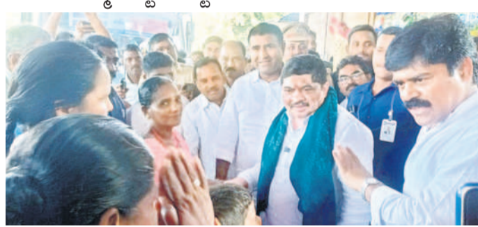
మహిళలతో మాట్లాడుతున్న మంత్రి పొన్నం ప్రభాకర్

రవాణా శాఖ మంత్రి పొన్నం ప్రభాకర్.. ఆర్కూర్ అర్టీసీ బస్టాండ్ పరిశీలన