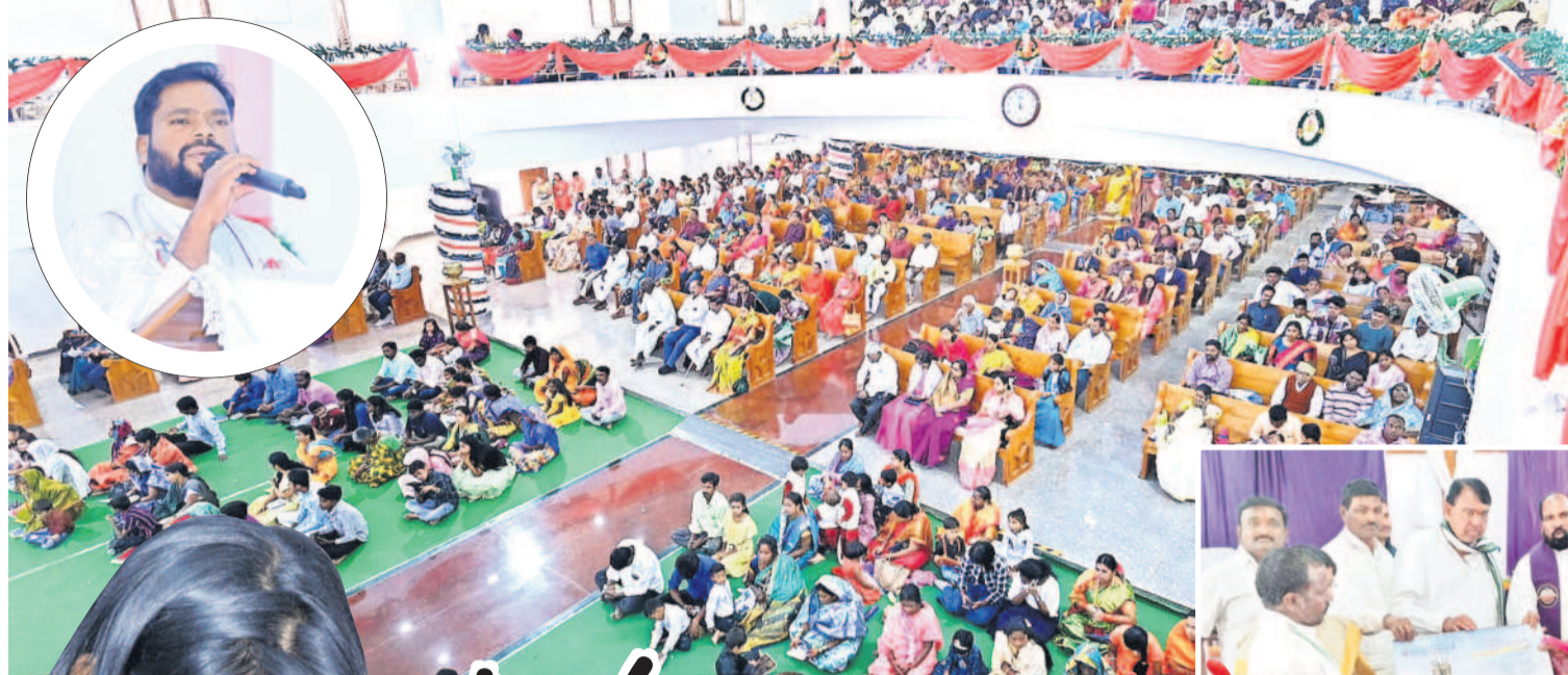
నిజామాబాద్ సీఎస్సీ వద్దలో సందేశాన్ని వినిపిస్తున్న పాదర్, హాజరైన క్రైస్తవులు

కిటుకిలాడిన చర్చిలు ప్రత్యేక పాఠశాలలు చేసిన క్రైస్తవులు క్రీస్తు సందేశాలను వివరించిన పాస్టర్లు పాల్గొన్న ఎమ్మెల్యేలు