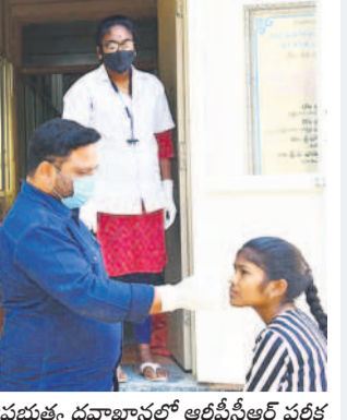
ప్రభుత్వ దవాఖానలో ఆక్రిమీసీఆర్ పరీక్ష చేస్తున్న వైద్యనిపుంధి

అయ్యప్ప స్వామిలూ జాగ్రత్త కొత్త వేరియంట్ జేఎన్-1 ఎక్కువగా కేరళ రాష్ట్రంలో విజృంభిస్తున్నది. ఈ నేపథ్యంలో శబరిమలకు వెళ్లే భక్తులు తగు జాగ్రత్తలు తీసుకోవాలని వైద్యులు సూచిస్తున్నారు. తప్పనిసరిగా మాస్కులు ధరించాలని, గుంపులు గుంపులుగా వెళ్లవద్దని చెబుతున్నారు. మహారాష్ట్ర, కర్ణాటక వంటి ఇతర రాష్ట్రాలకు వెళ్లే వచ్చిన వారు, విదేశాల నుంచి వచ్చిన వారు తప్పని సరిగా కొవిడ్ పరీక్ష చేసుకోవాలని, జాగ్రత్తగా ఉండాలని వైద్యులు చెబుతున్నారు. ఈ వైరస్ ఎక్కువ మందికి సోకి ప్రమాదం ఉంటుందని హెచ్చరిస్తున్నారు. అయితే ఇప్పటి వరకు సోకిన వారిలో వైరస్ ప్రభావం అంతగా లేదని, దీని తీవ్రతపై ఇంకా ఒక అంచనాకు రాలేదని చెబుతున్నారు. అయినా ముందు జాగ్రత్తలు తీసుకోవాల్సిన అవసరముందని, దీర్ఘకాలిక వ్యాధిగ్రస్తులు ఇమ్మ్యూనిటీని పెంచుకుంటే మరిచిపోవద్దని వైద్యులు సూచిస్తున్నారు.