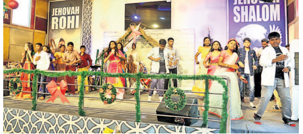
సంగారెడ్డిలోని చర్చిలో బాలబాలికల సాంస్కృతిక కార్యక్రమాలు