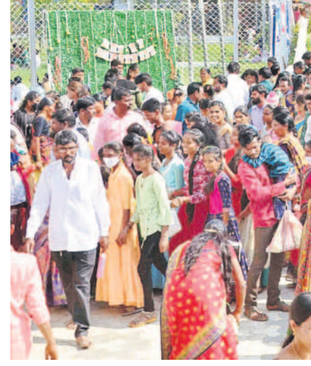
మెదక్ చర్చి ప్రాంగణంలో భక్తుల సందడి

క్రిస్టెన్ ఆరాధించడమే క్రిస్టెన్ పండుగ.. క్రిస్టు రాక ఈ లోకానికి శుభసూచకమని మెదక్ బిషప్ రెవరెండ్ పద్దారావు అన్నారు. ఆకాశంలో తోక చుక్క ఉద్భవించగానే మన జీవితాలు మార్చడానికి వచ్చిన దేవుడి ఏనుప్రభువు అన్నారు. ప్రేమ, శాంతి, ఐక్యత క్రిస్టెన్ సందేశమన్నారు. ప్రజలు, క్రైస్తవులు, మహా దేవాలయానికి విచ్చేసిన భక్తులకు క్రిస్టెన్ శుభాంక్షలు తెలిపారు. ఏనుప్రభుత్వ గీతాలతో చర్చి మార్చాగింది. బిషప్ పద్దారావు, బిషప్ ముఖ్య విజయ, చర్చి కమిటీ సభ్యులు, పాస్టర్లతో కలిసి క్రిస్టెన్ కేక్ కట్ చేసి సీఎస్ఎఫ్ నూతన సంవత్సరం కార్యక్రమాలను ఆవిష్కరించారు. 2024 సంవత్సరాంతం శతాబ్ది వేడుకలు నిర్వహిస్తామన్నారు.