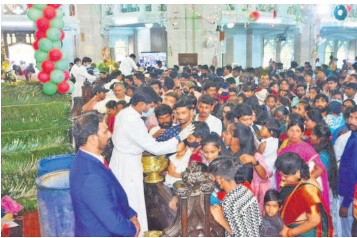
మెదక్ చర్చిలో భక్తులను ఆశీర్వాదిస్తున్న పాదర్