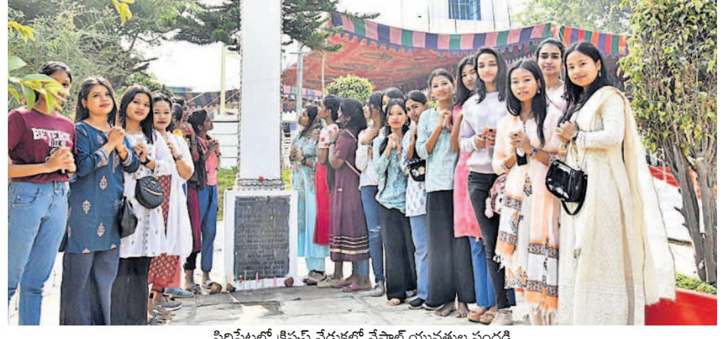
సిద్దిపేటలో క్రిస్టెన్ వేడుకల్లో నేపాల్ యువతుల సందడి