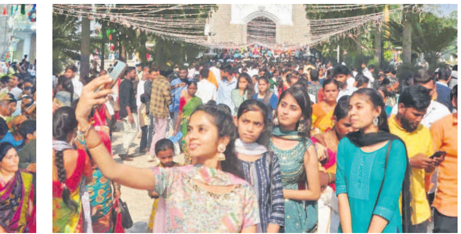
తీపి జ్ఞాపకం: మెదక్ చర్చి ముందు సెల్ఫీ దిగుతున్న యువతులు