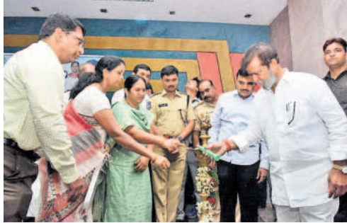
క్షేత్ర ప్రజ్వలన చేసే కార్యక్రమాన్ని ప్రారంభిస్తున్న వైద్యారోగ్య శాఖ మంత్రి దామోదర రాజనర్సింహ

సంగారెడ్డి కలెక్టరేట్, డిసెంబర్ 25 : ప్రభుత్వ పథకాలు అర్హులకే అందించే దిశగా అధికారులు, ప్రజాప్రతినిధులు సమన్వయంతో పని చేయాలని రాష్ట్ర వైద్యారోగ్య శాఖ మంత్రి దామోదర రాజనర్సింహ కోరారు. సోమ