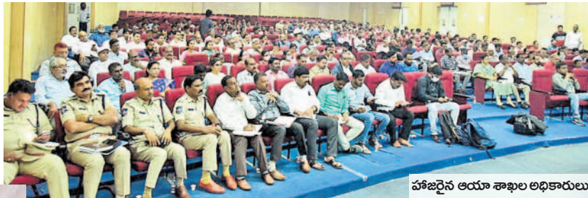
హాజరైన ఆయా శాఖల అధికారులు