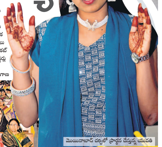
మొయిసాబాద్ చర్చిలో ప్రార్థన చేస్తున్న యువతి