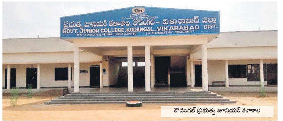
కొడంగల్ ప్రభుత్వ జూనియర్ కళాశాల