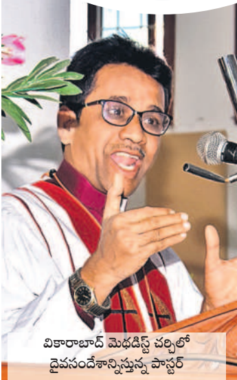
వికారాబాద్ మెథడిస్ట్ చర్చిలో దైవసందేశాన్నిస్తున్న పాస్టర్