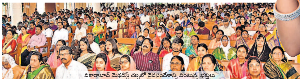
వికారాబాద్ మెథడిస్ట్ చర్చిలో దైవసందేశాన్ని వింటున్న భక్తులు