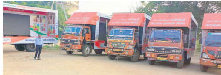
గ్రామాల్లో తిరిగే ప్రచార వాహనాలు