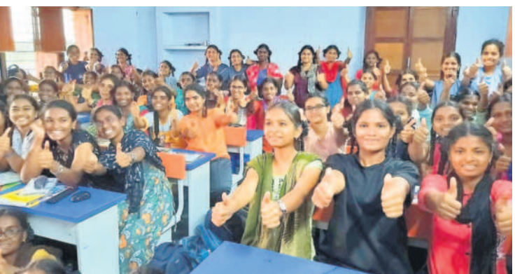
మునుగోడులోని బాలికల గురుకుల విద్యార్థినులు

రాష్ట్ర ప్రభుత్వం ఉమ్మడి జిల్లా వ్యాప్తంగా 90