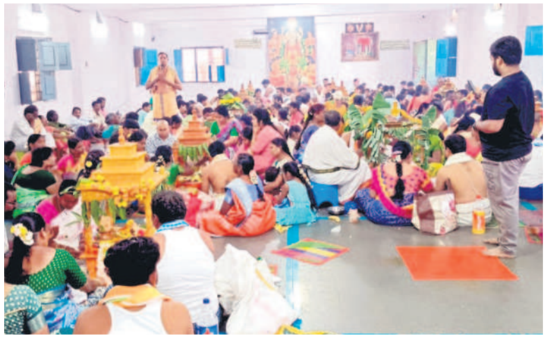
సామూహిక సత్యనారాయణ స్వామి ప్రతం ఆచరిస్తున్న భక్తులు