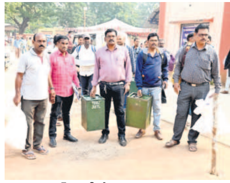
పోలింగ్ సామగ్రితో విధులకు వెళ్తున్న సిబ్బంది

సింగరేణి గుర్తింపు సంఘం ఎన్నికల సమరానికి సర్పంచ్ సిద్ధమైంది. నేడు 11 ఏరియల్ పోలింగ్ నిర్వహించేందుకు యంత్రాంగం సన్నద్ధమైంది. మొత్తం 13 సంఘాలు పోటీ చేస్తుండగా, 84 పోలింగ్ కేంద్రాలను ఏర్పాటు చేసేందుకు, 39,827 మంది ఓటు హక్కును వినియోగించుకోవడానికి, ఆ వెంటే కౌంటింగ్ పూర్తి చేసి ఫలితాలు వెలువరించనున్నది.