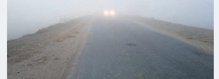
ఉదయం 7 గంటలకు లెట్టు వేసుకొని వెళ్తున్న వాహనం

ఉమ్మడి ఆదిలాబాద్ జిల్లాను చరి వశికిస్తున్నది. ఉష్ణోగ్రతలు వడిపోయి తీవ్రత పెరిగింది. మంగళవారం కనిష్టంగా 8.9 డిగ్రీలు నమోదుకాగా, ఉదయం 8 నుంచి 9 గంటల వరకు దట్టమైన పొగమంచు కమ్ముకున్నది. వాహనాల రాకపోకలకు ఇబ్బందులు పడగాల్సి వచ్చింది. తప్పనిసరి పరిస్థితుల్లో హెడ్లైట్లు వేసుకొని ప్రయాణించాల్సి పరిస్థితి నెలకొంది. ఇక సాయంత్రం అంతటా కంటే ముందే కూల్బిలు, రైతులు వసులు ముగించుకొని ఇళ్లకు చేరారు. చిన్నా పెద్దలంతా ఒకచోట చేరి చలిమంచులు వేసుకున్నారు. -బెజ్జూర్, డిసెంబర్ 26