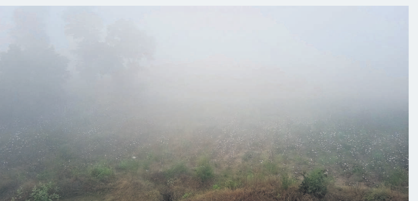
కుకుడ లో పత్తి చేపట్టు కమ్ముకున్న పాగమంచు