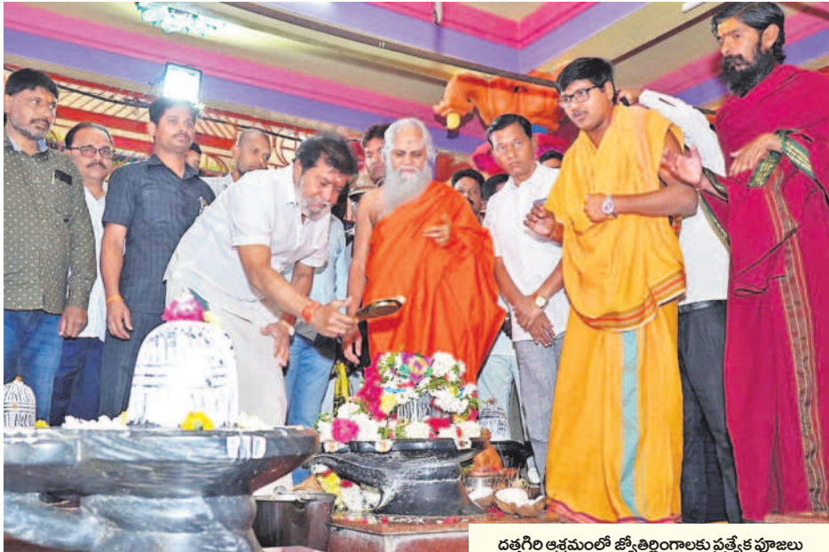
దత్తగిరి ఆశ్రమంలో జ్యోతిర్లింగాలకు ప్రత్యేక పూజలు చేసి దర్శించుకుంటున్న వైద్య, ఆరోగ్య శాఖ మంత్రి దామోదర రాజానర్సింహ