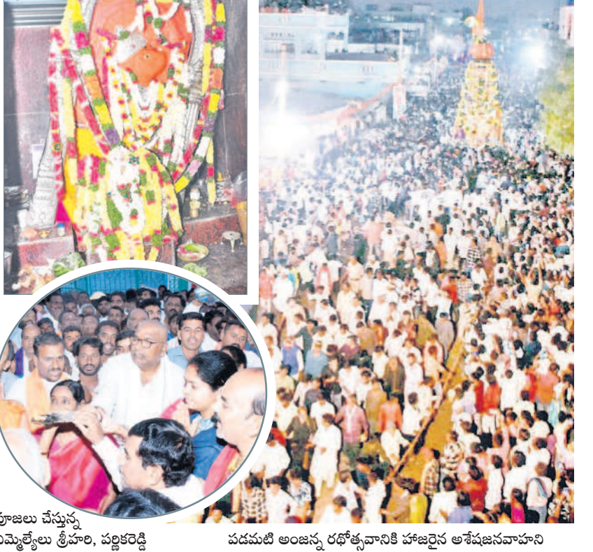
పూజలు చేస్తున్న ఎమ్మెల్యేలు శ్రీహరి, పల్లకెడ్డి పడమటి అంజన్ రథోత్సవానికి హాజరైన అవేక్షణనవాహిని