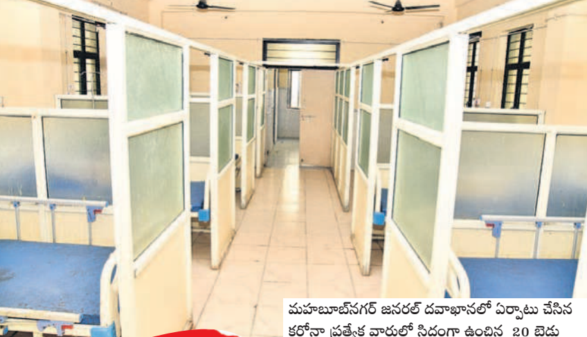
మహబూబ్ నగర్ జనరల్ దవాఖానలో ఏర్పాటు చేసిన కరోనా ప్రత్యేక వార్డులో సిద్ధంగా ఉంది 20 బెడ్లు