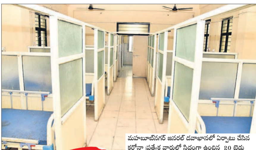
మహబూబ్ నగర్ జనరల్ దవాఖానలో ఏర్పాటు చేసిన కరోనా ప్రత్యేక వార్డులో సిద్ధంగా ఉంది 20 బెడ్లు