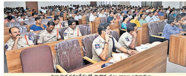
సన్నాహక సమావేశంలో పాల్గొన్న పలు శాఖల అధికారులు