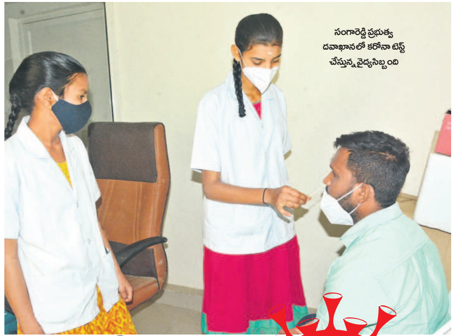
సంగారెడ్డి ప్రభుత్వ దవాఖానలో కరోనా టెస్ట్ చేస్తున్న వైద్యసిబ్బంది