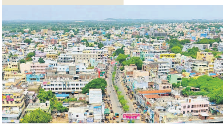
సిద్దిపేట పట్టణ వ్యాప్తి