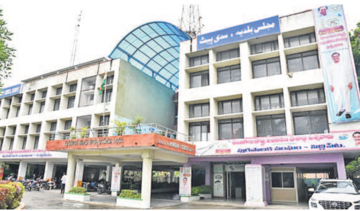
సిద్దిపేట మున్సిపల్ కార్యాలయం