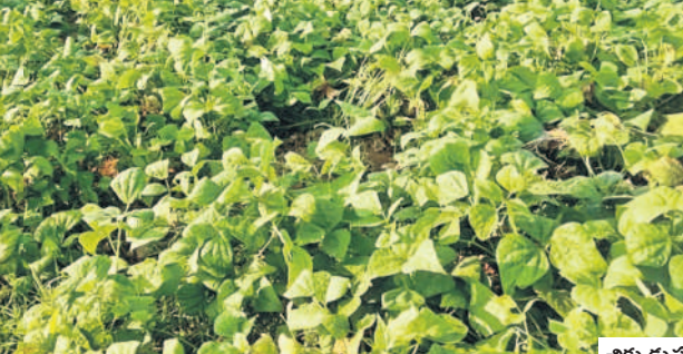
చిక్కడు పంట సాగు

కొని లాభాలు అర్జిస్తున్నారు. వంటిమామిడి మార్కెట్కు నీళ్లం క్లింట్లతో కొద్ది కూరగాయలను రైతులు తీసుకొచ్చి ఫ్రైవేటు సయ్యలకు విక్రయిస్తున్నారు. ఇక్కడి నుంచి వివిధ జిల్లాలకు తాజా కూరగాయలను తరలిస్తున్నారు. ఆరుతడి వద్ద తుల్సీ రైతులు కూరగాయలను సాగు చేయడంతో అధిక లాభాలు సాధించుతున్నారు. ఆరుతడి పంటలను సాగు చేసేలా రైతులను వ్యవసాయాధికారులు ప్రోత్సహిస్తున్నారు.