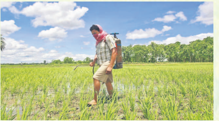
పంటపై పురుగుల మందు పిచికారి చేస్తున్న రైతులు