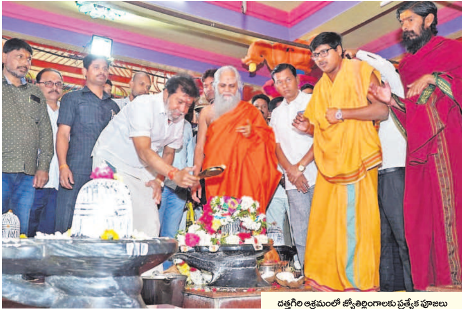
దత్తగిరి ఆశ్రమంలో జ్యోతిర్లింగాలకు ప్రత్యేక పూజలు చేసి దర్శించుకుంటున్న వైద్య, ఆరోగ్య శాఖ మంత్రి దామోదర రాజానర్సింహ