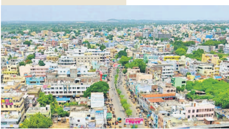
సిద్దిపేట పట్టణ వ్యాప్తి