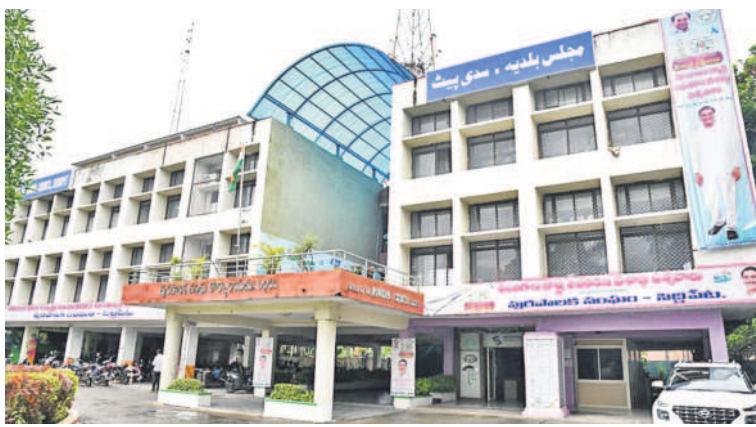
సిద్దిపేట మున్సిపల్ కార్యాలయం