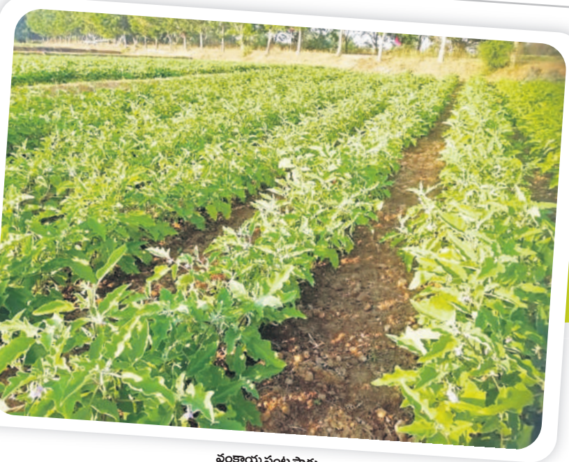
వంకాయ పంట సాగు

గజ్వేల్, డిసెంబర్ 26: ఆరు తడి పంటలతో అధిక లాభాలు సాధించేందుకు రైతులు ఆ దిశగా అడుగులు వేస్తున్నారు. ముఖ్యంగా కూరగాయల పంటలు సాగు చేస్తూ దిగుబడి సాధిస్తున్నారు. తక్కువ నీటితో పండించే మొక్కజొన్న, ఉల్లిగడ్డ, పూలతోటల పెంపకంపై వైద్యుడిని సంప్రదించాలి. సిద్దిపేట జిల్లా గజ్వేల్ ప్రాంతంలో రైతులు పండించిన కూరగాయలు, స్వీట్కార్న్ మొక్కజొన్నను హైదరాబాద్లోని వివిధ మార్కెట్లకు ఎగుమతి చేస్తున్నారు. హైదరాబాద్ పట్టణానికి సరిపడా కూరగాయలను ఎగుమతి చేయడంలో గజ్వేల్ ప్రాంత రైతులే ఎక్కువ.