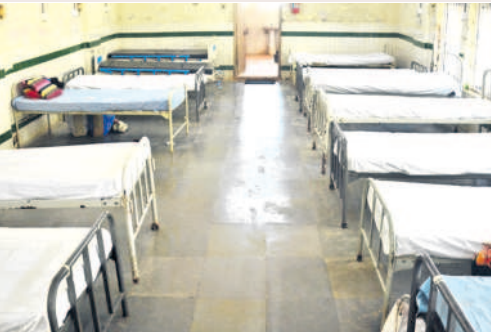
సంగారెడ్డి దవాఖానంలో ఏర్పాటు చేసిన ప్రత్యేక వార్డు