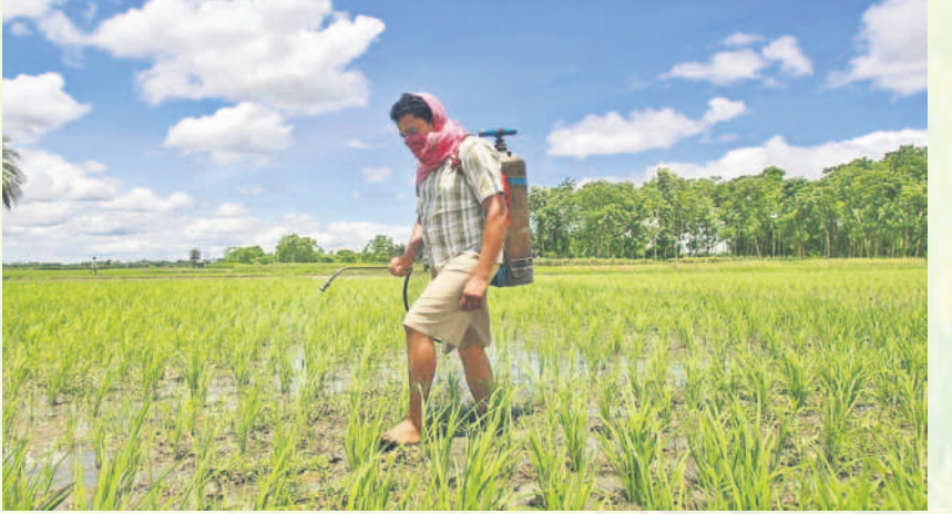
పంటపై పురుగుల మందు పిచికారి చేస్తున్న రైతులు