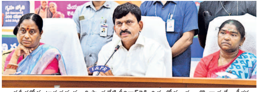
సమీక్షలో మాట్లాడుతున్న మంత్రి పొంగలలేటి శ్రీనివాస్ రెడ్డి, చిత్రంలో మంత్రులు కొండా సురేఖ, సీతక్క