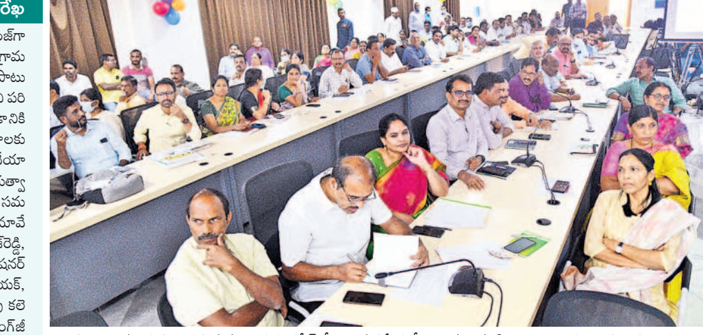
ప్రజాపాలన నిర్వహణపై హనుమకొండ కలెక్టరేట్ లో జరిగిన సమీక్షలో పాల్గొన్న ఉమ్మడి జిల్లా అధికారులు, ప్రజాప్రతినిధులు