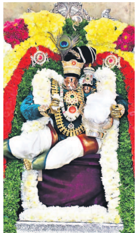
వెన్నముద్ద కృష్ణుడి అలంకారంలో లక్ష్మీనరసింహ స్వామి

వరంగల్, విజయవాడ హైవేలపై వాహన దారుల ఇక్కట్లు దట్టంగా కురుస్తున్న మంచుతో జనం ఉక్కిరిబిక్కిరి దగ్గరికొచ్చేదాకా కనిపించని వాహనాలు రోడ్లపై వాహన రాకపోకలకు తీవ్ర అంతరాయం