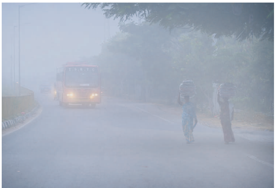
సూర్యాపేటలో పొగమంచుతో లైట్లు వేసుకొని వెళ్తున్న వాహనాలు

ఉమ్మడి జిల్లాకు వాతావరణ శాఖ ఎల్లో అల్బర్ట్ జారీ