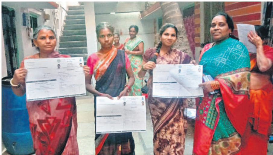
నగరంలో ప్రజాపాలన దరఖాస్తులను పంపిణీ చేస్తున్న స్వయం సహాయక బృందాల మహిళలు