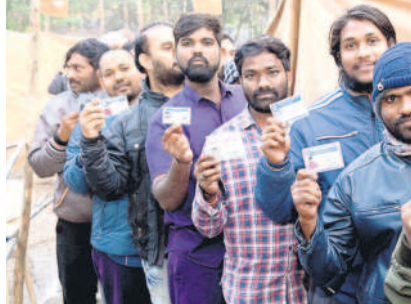
శ్రీరాంపూర్ : ఓటింగ్ ఓటింగ్ చూపుతున్న సింగరేణి కార్మికులు

ఓటింగ్ లో పాల్గొన్నారు. కౌంటింగ్ అలస్యం.. రాత్రి 8 గంటలకు కౌంటింగ్ ప్రక్రియ మొదలైంది.