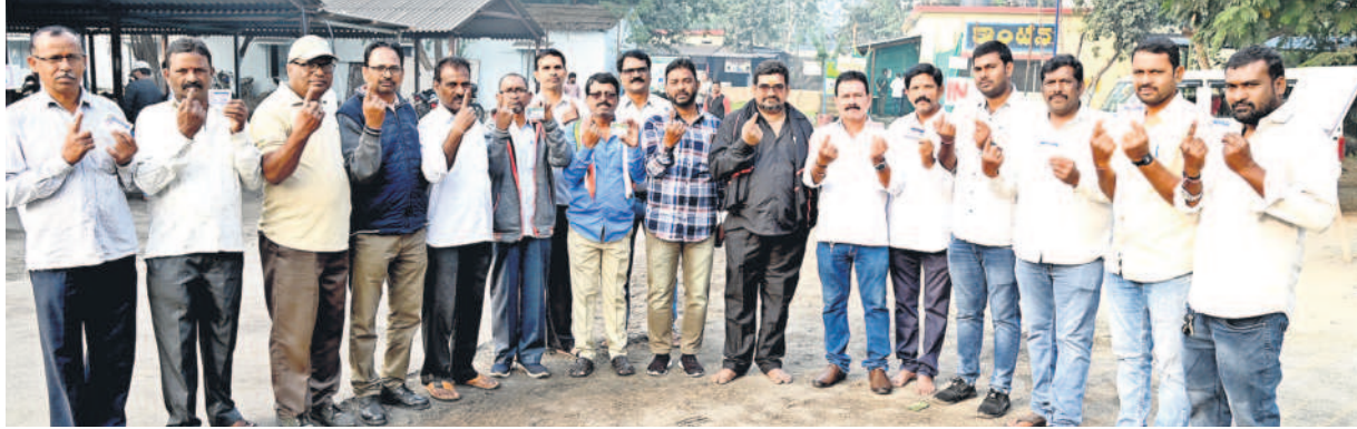
శ్రీరాంపూర్ : ఓటు వేసినట్లు సీరా గుర్తు చూపిస్తున్న సింగరేణి కార్మికులు

ఉండగా, వీరిలో 8,491 మంది ఓటు హక్కును వినియోగించుకున్నారు. శ్రీరాంపూర్ ఓటే అత్యధికంగా 96.4 శాతం ఓట్లు పోలయ్యాయి. ఎస్పార్డీ 1 ఏరియాలో 95.2 శాతం, ఎస్పీపీలో 95.3 శాతం పోలింగ్ నమోదైంది. బెల్లంపల్లి ఏరియాలో 996 మంది ఓటు ధర్మగాను 959 మంది ఓటు హక్కును వినియోగించుకున్నారు. బీపీఎ ఓటింగ్, ఖైరగూడ, సీపీఎపీలో 96 శాతానికి పైగా పోలింగ్ జరిగింది. మందమల ఏరియాలో 4,835 ఓట్లకుగాను 4,515 మంది ఓట్లు పోలయ్యాయి. అర్రేపీ ఓటింగ్ 96 శాతం, ఎన్కే పైన్, కేకే 5, కమ్యూనిటీ హాల్ (పాత సీపీఎస్ఎఫ్ క్యాంపు) కేంద్రాల్లో 95 శాతానికి పైగా పోలింగ్ నమోదైంది. ఉదయం ఏడు గంటల నుంచి కార్మికులు పోలింగ్ కేంద్రాల వద్ద భావాలను తీరిక పొందారు. పద్దెనిమిది వచ్చిన వారు ఉదయం, సెకండ్ షిఫ్ట్ లో వారు ముగిస్తున్నాం, నైట్ షిఫ్ట్ ద్వారా చేసిన వారు ఉదయమే