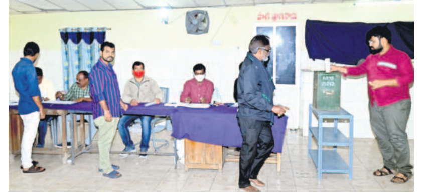
శ్రీరాంపూర్ : ఓటు హక్కు వినియోగించుకున్న కార్మికులు

యంత్రకు 13 క్రమంలో పెట్టి వారికి వచ్చిన ఓట్లను అందులో చేశారు. అనంతరం కౌంటింగ్ చేశారు. అంతా ముగిసే సరికి అర్ధరాత్రి అయ్యింది. సింగరేణి వ్యాప్తంగా మొత్తం 11 ఏరియాల్లో ఇల్లందులో తొలి ఫలితం వచ్చింది.. 631 ఓట్ల మాత్రమే ఉన్న ఏరియా ఇది. అనంతరం బెల్లంపల్లి, కోత్తగూడెం, కాల్వోలేట్ తరువాత అన్నింటికంటే చివరగా శ్రీరాంపూర్ ఫలితం వచ్చింది.