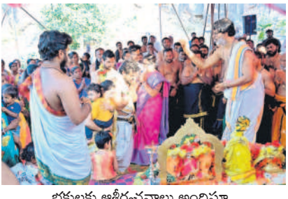
భక్తులకు ఆశీర్వాదాలు అందిస్తూ..

● సందడిగా అయ్యింది ఆలయం దండేపల్లి, డిసెంబర్ 27 : గూడెం ఆలయ శబరిమలై అయ్యప్ప ఆలయంలో బుధవారం మహా మండల పూజ మహోత్సవాన్ని ఆత్మీయ వైభవంగా నిర్వహించారు. గురుస్వామి చక్రవర్తి పురుషోత్తమ మూర్తుల ఆధ్వర్యంలో గురుస్వామిలు దీవ్య దుస్తింబడి పూజను ఘనంగా నిర్వహించారు. ఈ సందర్భంగా ఆలయంలో పద్దెనిమిది మెట్లను పూజతో అందంగా అలంకరించారు. అష్టోత్తర శతకలశాభిషేకం, మహాపడిపూజ, అభిషేకాలు, కుంకుమార్చనలు, స్వామి వారికి పుష్పాభిషేకం, పంచామృతాభిషేకాలు నిర్వహించారు. స్వామియే శరణం అయ్యింది అంటూ స్వామిలు ఆధ్యాత్మిక గీతాలు అలపించారు. గురుస్వామిల మంత్రోచ్ఛారణల మధ్య అయ్యప్ప శరణాగతితో ఆలయ ప్రాంతం మర్యాదగా ఉంది. వివిధ ప్రాంతాల నుంచి వచ్చిన భక్తులతో గుట్ట ప్రాంతం సందడిగా మారింది.