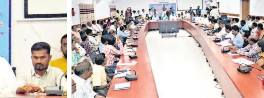
పాల్గొన్న అధికారులు, ప్రజాప్రతినిధులు