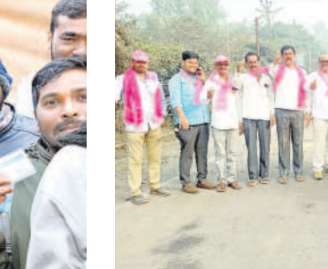
శ్రీరాంపూర్ : అర్రే-6 గవి వద్ద ఓటింగ్ చేసిన నాయకులు

భోజనం చేసిన అనంతరం కౌంటింగ్ మొదలు పెట్టారు. అన్ని గదుల నుంచి వచ్చిన పోలింగ్ డబ్బాలను ఏజెంట్లకు చూపించాక సీల్ ఓపెన్ చేశారు. అనంతరం 25 ఓట్ల చొప్పున కట్టలు కట్టారు. 13 యూనిట్లను