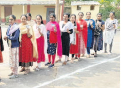
మందమలలోని పోలింగ్ బాతౌల్ట్ కూర్చో నిల్చున్న యువకులు