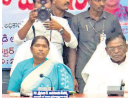
సమావేశంలో మాట్లాడుతున్న ఉమ్మడి అధికారి జిల్లా ఇన్చార్జి మంత్రి సీతక్క

● అర్జులందరికీ పంపిణీ చేస్తాం.. ● ఉమ్మడి జిల్లా ఇన్చార్జి మంత్రి సీతక్క