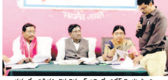
సమావేశానికి హాజరైన చెన్నూర్ ఎమ్మెల్యే వివేక్ వెంకటస్వామి

● హాజరైన చెన్నూర్ ఎమ్మెల్యే వివేక్ వెంకటస్వామి