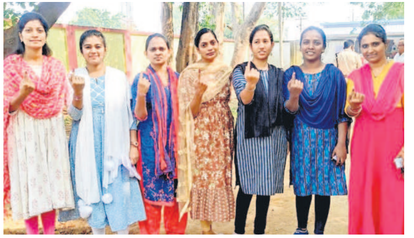
రెజిస్ట్రేషన్ : గోలేటి పీఠం సెంటర్లో ఓటు హక్కు వినియోగించుకున్న ఓటు కార్మికుల యువకులు