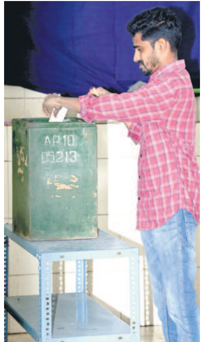
శ్రీరాంపూర్ లో ఓటు హక్కు వినియోగించుకుంటున్న కార్మికుడు

మంచెలమల, డిసెంబర్ 27 (నమస్తే తెలంగాణ ప్రతినిధి): సింగరేణిలో గుర్తింపు కార్మిక సంఘం ఎన్నికల్లో కార్మికులు ఓటిస్తారు. వాయిదాలు. కోర్టు కట్టే వరకు తర్జన తర్జన మధ్య ప్రశాంత వాతావరణంలో సింగరేణిలో ఏడో దశా గుర్తింపు సంఘం ఎన్నికలు బుధ వారం నిర్వహించారు. ఉదయం ఏడు గంటల నుంచి సాయంత్రం ఐదు గంటల వరకు పోలింగ్ నిర్వహించారు. అనంతరం కౌంటింగ్ సెంటర్ లో బ్యాలెట్ లు లెక్కించారు. మంచెలమల జిల్లాలోని శ్రీరాంపూర్, మందమల, బెల్లంపల్లిలో పాటు రాష్ట్ర వ్యాప్తంగా 11 ఏరియాల్లో పోలింగ్ నిర్వహించారు. సింగరేణిలోనే అత్యధిక ఓట్లను ఉన్న శ్రీరాంపూర్ ఏరియాలో 9,127 మంది ఓట్లను