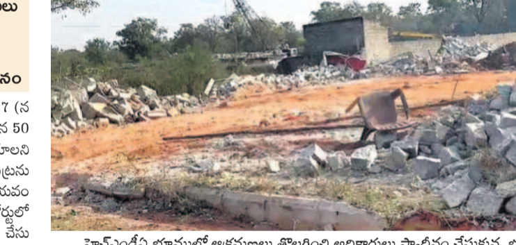
మోవంపేటి భూముల్లో అక్రమణలు తొలగించి అధికారులు స్వాధీనం చేసుకున్న భూమి

హైదరాబాద్ సీటీఎమ్ కోర్టు, డిసెంబర్ 27 (నమస్తే తెలంగాణ): రూ. 1000 కోట్ల విలువైన 50 ఎకరాల ప్రభుత్వ భూములను కోట్లలకాలని పక్కా ప్లాన్ చేసిన ఇద్దరు కబ్బాదారుల కుట్రను కేసీఆర్ నేతృత్వంలోని గౌరవ ప్రభుత్వం విలయం చేసింది. పక్కా అధికారులతో హైకోర్టులో వాదించి ఆ భూములను తిరిగి సొంతం చేసుకుంది. అవి ప్రభుత్వ భూములేనంటూ ఈ నెల 14న హైకోర్టు తీర్పు చెప్పడంతో కబ్బాదారుల నుంచి వాటికి శాశ్వత విముక్తి లభించింది. శంషాబాద్ ఔట్ రింగ్ రోడ్డు నుంచి జాతీయ రహదారి మధ్య