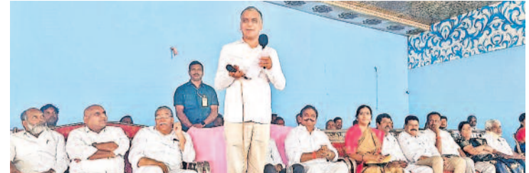
బీఆర్ఎస్ నాయకులు, కార్యకర్తల సమావేశంలో మాట్లాడుతున్న మాజీ మంత్రి హాజరైతే

మెడకే, డిసెంబర్ 27 (నమస్తే తెలంగాణ): రాష్ట్రంలో అధికారంలోకి వచ్చేందుకు కాంగ్రెస్ పార్టీ ఇచ్చిన మ్యానిఫెస్టోలో 412 హామీలున్నాయని, వాటిలో ఎన్ని అమలు చేసేదో.. ఎంత పని చేస్తారో.. బుధవారం హైదరాబాద్ లో జరిగిన ఈ ఒప్పంద కార్యక్రమంలో ఆయన మాట్లాడుతూ.. ఇప్పటికే తాము సౌర విద్యుత్తును ఉత్పత్తి చేస్తున్నామని, పవన విద్యుత్తు గంగలోకి అడుగు పెట్టమని వివరించారు.