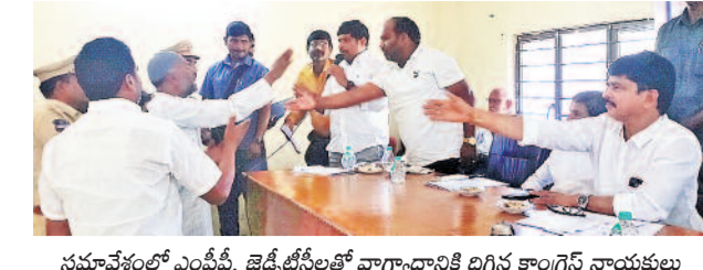
సమావేశంలో ఎంపీ, జెడ్పీటీసీలతో మాట్లాడానికి దిగిన కాంగ్రెస్ నాయకులు

ఆరు గ్యారెంటీలు పొందాలంటే అధార్ కార్డు తప్పనిసరి కావడంతో అధార్ లో వివరాలను అప్డేట్ చేసుకునేందుకు ప్రజలు అధార్ కేంద్రాలకు బారులు తీరుతున్నారు. అక్కడ పెద్ద ఎత్తున క్యూలు ఉండటంతో ఓపిక తో క్యూలో చెప్పలు పెట్టి వక్రస్వరం చేస్తుంటున్నారు. బుధవారం మంచి రోజు వట్టణంలోని ఓ అధార్ కేంద్రం వద్ద క్యూలో చెప్పలు పెట్టిన దృశ్యమే అయ్యింది.