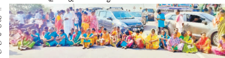
మాగసూర్ హైవేపై ధర్నా చేస్తున్న గ్యారన్ వినియోగదారులు

• రూ.500 కూలి వదులుకొని వచ్చినా పనికావడం లేదని ప్రజల ఆగ్రహం • జాతీయ రహదారిపై ధర్నాకు దిగిన గ్యారన్ వినియోగదారులు మాగసూరు డిసెంబర్ 27 : మండల కేంద్రంలోని గ్యారన్ డిస్ట్రిబ్యూటర్ వద్ద ఈకేవైసీ చేయమని కునేందుకు రూ.200 ఎందుకు అవసరమో చెప్పాలని గ్యారన్ వినియోగదారులు ప్రశ్నిస్తున్నారు. వినియోగదారుల ధర్నా దిగి బిజ్నెసులను అడ్డుకోవడాన్ని నిరసనగా ప్రజలు బుధవారం జాతీయ రహదారిపై ధర్నా నిర్వహించారు. ఈ సందర్భంగా వారు మాట్లాడుతూ నూతనంగా ఏర్పడిన కాంగ్రెస్ ప్రభుత్వం తెలంగాణ అరు గ్యారంటీలలో ముందుకు వచ్చిందని అందులో రూ.500కే ప్రజలకు సిలిండర్ అందిస్తామంటూ ప్రచారం చేయడంతో అధికారంలోకి రాగానే ప్రజలు గ్యారన్ సిలిండర్ కేంద్రం వద్ద ఈకేవైసీ కోసం పడిగాపులు కాస్తున్నారని ఆవేదన వ్యక్తం చేశారు. ఈకేవైసీ చేయాలంటే రూ.200 పనులు చేస్తున్నారని, ఈ కేవైసీ తప్పనిసరి అనడంతో మహిళలు రూ.500 కూలి వదులుకొని సిలిండర్ కేంద్రాల వద్ద రోజూ తరచు పడిగాపులు కాస్తున్నామని అవుతుందన్న నమ్మకం లేదని దీంతో ప్రతి ఒక్కరికీ రోజూ రూ.700 నష్టం జరుగుతున్నదని ఆరోపించారు. అయితే జాతీయ రహదారిపై ధర్నా చేస్తున్న విషయం తెలుసుకున్న పోలీసులు అక్కడికి చేరుకొని గ్యారన్ డిస్ట్రిబ్యూటర్ వారితో మాట్లాడి అందరికీ ఈకేవైసీ అయ్యేలా చూడాలని మాట్లాడడంతో వినియోగదారులు ధర్నా విరమించారు.