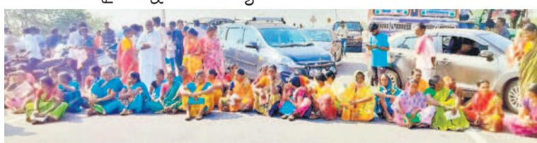
మాగసూరు హైవేపై ధర్నా చేస్తున్న గ్యారన్ వినియోగదారులు

• రూ.500 కూలి వదులుకొని వచ్చినా పనికావడం లేదని ప్రజల ఆగ్రహం • జాతీయ రహదారిపై ధర్నాకు దిగిన గ్యారన్ వినియోగదారులు మాగసూరు డిసెంబర్ 27 : మండల కేంద్రంలోని గ్యారన్ డిస్ట్రిబ్యూటర్ వద్ద ఈకేవైసీ చేయమని కునేందుకు రూ.200 ఎందుకు అవసరమో చెప్పాలని గ్యారన్ వినియోగదారులు ప్రశ్నిస్తున్నారు. వినియోగదారుల ధర్నా కేసులు వసూలు చేయడాన్ని నిరసనగా ప్రజలు బుధవారం జాతీయ రహదారిపై ధర్నా నిర్వహించారు. ఈ సందర్భంగా వారు మాట్లాడుతూ నూతనంగా ఏర్పడిన కాంగ్రెస్ ప్రభుత్వం తెలంగాణ అరు గ్యారంటీలలో ముందుకు వచ్చిందని అందులో రూ.500కే ప్రజలకు సిలిండర్ అందిస్తామంటూ ప్రచారం చేయడంతో అధికారంలోకి రాగానే ప్రజలు గ్యారన్ సిలిండర్ కేంద్రం వద్ద ఈకేవైసీ కోసం పడిగాపులు కాస్తున్నారని అవేదన వ్యక్తం చేశారు. ఈకేవైసీ చేయాలంటే రూ.200 వసూలు చేస్తున్నారని, ఈ కేవైసీ తప్పనిసరి అనడంతో మహిళలు రూ.500 కూలి వదులుకొని సిలిండర్ కేంద్రం వద్ద రోజూ తరచు పడిగాపులు కాస్తున్నామని అవుతుందన్న నమ్మకం లేదని దీంతో ప్రతి ఒక్కరికీ రోజూ రూ.700 నష్టం జరుగుతున్నదని ఆరోపించారు. అయితే జాతీయ రహదారిపై ధర్నా చేస్తున్న విషయం తెలుసుకున్న పోలీసులు అక్కడికి చేరుకొని గ్యారన్ డిస్ట్రిబ్యూటర్ వారితో మాట్లాడి అందరికీ ఈకేవైసీ అయ్యేలా చూడాలని మాట్లాడడంతో వినియోగదారులు ధర్నా విరమించారు.