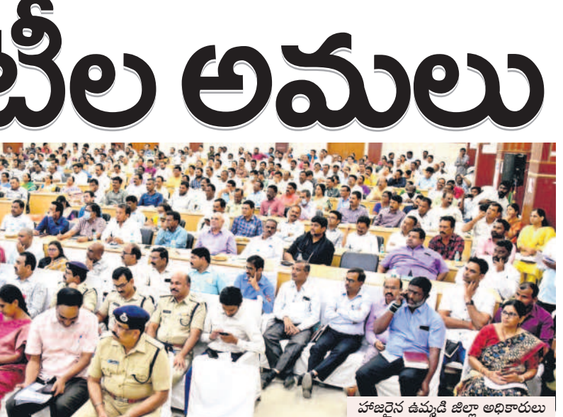
హాజరైన ఉమ్మడి జిల్లా అధికారులు