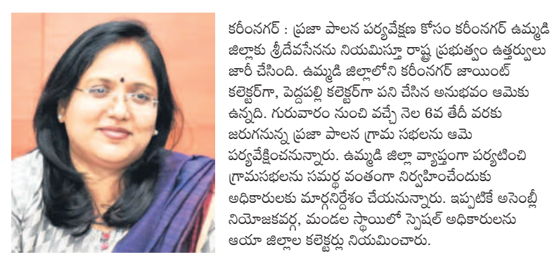
కరీంనగర్ : ప్రజా పాలన పర్యవేక్షణ కోసం కరీంనగర్ ఉమ్మడి జిల్లాకు శ్రీదేవసేనను నియమిస్తూ రాష్ట్ర ప్రభుత్వం ఉత్తర్వులు జారీ చేసింది. ఉమ్మడి జిల్లాలోని కరీంనగర్ జాయింట్ కలెక్టరీగా, పెద్దపల్లి కలెక్టరీగా పని చేసిన ఆమెకు ఆమెకు ఉన్నది. గురువారం నుంచి వచ్చే నెల 6వ తేదీ వరకు జరుగుతున్న ప్రజా పాలన గ్రామ సభలను ఆమె పర్యవేక్షించునున్నారు. ఉమ్మడి జిల్లా వ్యాప్తంగా పర్యటించి గ్రామసభలను సమర్థ వంతంగా నిర్వహించేందుకు అధికారులకు మార్గనిర్దేశం చేయనున్నారు. ఇప్పటికే అసెంబ్లీ నియోజకవర్గ, మండల స్థాయిలో స్పెషల్ అధికారులను ఆయా జిల్లాల కలెక్టర్లు నియమించారు.