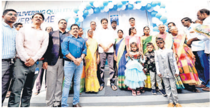
ఎల్లారెడ్డిపేట మండలం పదిలో దశిబంధం లబ్ధిదారులతో ఎమ్మెల్యే కేటీఆర్