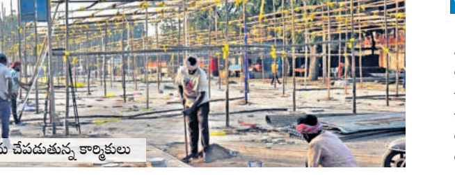
స్టాల్ నిర్మాణ పనులను చేపడుతున్న కార్యకులు

ఎగ్జిబిషన్ నిర్వహణ ద్వారా వస్తున్న ఆదాయంతో ఎగ్జిబిషన్ సాఫైలో రాష్ట్రంలోని పలు జిల్లాల్లో విద్యా వ్యాప్తికి కృషి చేస్తోంది. ముఖ్యంగా మహిళా విద్యా వ్యాప్తికి గాను మహిళా కళాశాలలు, పాలిటెక్నిక్, పార్లీస్, ఇంజనీరింగ్, డిగ్రీ, ఐటీఐ కళాశాలలను స్థాపించింది. పలు జిల్లాల్లో ఎగ్జిబిషన్ ఆధ్వర్యంలో 20 విద్యా సంస్థలు కొనసాగుతున్నాయి. ఏటా ఆయా విద్యా సంస్థల ద్వారా దాదాపు 30 వేల మంది విద్యార్థులు విద్యనభ్యసిస్తున్నారు.