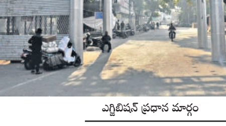
ఎగ్జిబిషన్ ప్రధాన మార్గం