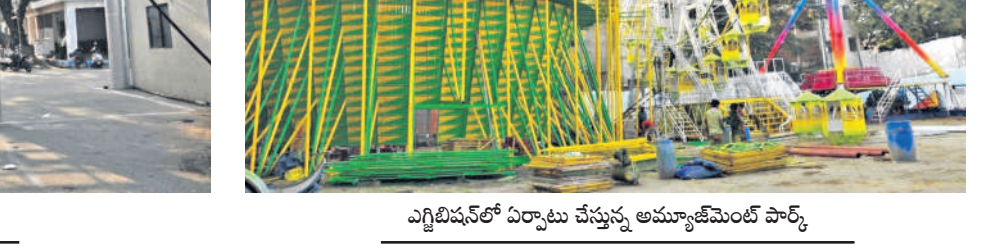
ఎగ్జిబిషన్ లో ఏర్పాటు చేస్తున్న అమ్మకాజేమెంట్ పార్కు