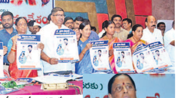
ఆరు గ్యారంటీల అమలు పాస్పర్లను అవిష్కరిస్తున్న మంత్రి కొండా సురేఖ, ఎంపీ, ఎమ్మెల్యేలు, ఎమ్మెల్యేలు