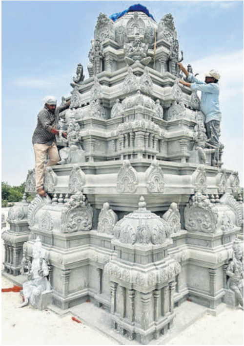
వరదరాజస్వామి దేవాలయంలో నిర్మించిన త్రికలక గోపురాలు