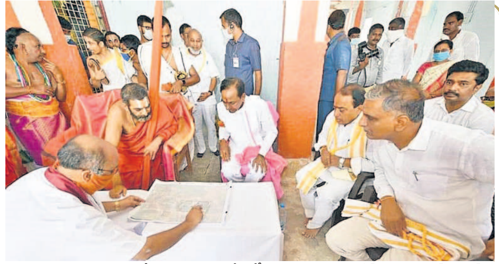
ఆలయ నిర్మాణంపై మౌఖిక పరిశీలిస్తున్న గులాబీ అధినేత కేసీఆర్, మాజీ మంత్రులు హరిశ్చంద్రావు, ఇంద్రకరణ్ రెడ్డి (ఫైర్)