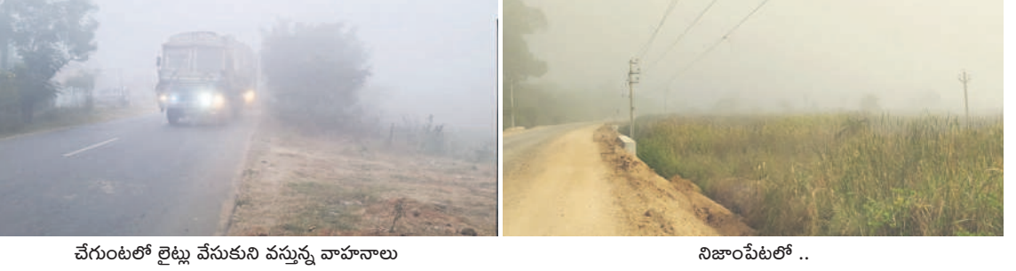
చేరుంట్లో లైట్లు వేసుకుని వస్తున్న వాహనాలు నిజాంపేటలో ..

- న్యూనెట్ వర్గం, మెదక్/ సంగారెడ్డి జిల్లా, డిసెంబర్ 26