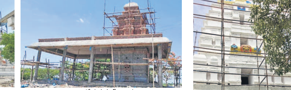
నిర్మాణంలో హనుమాన్ ఆలయం

డాన్ని చేస్తున్నారు. త్రికలక గాలిగోపురాన్ని యథావిధిగా నిర్మించారు. అధ్యయన మండపం, హోమశాలలు నిర్మిస్తున్నారు. వంశలోహ సమేత ధ్వజాక్షతం యథావిధిగా ప్రతిష్ఠించనున్నారు. స్వామికి ధ్యాన పాలకులైన జయం, విజయాలను ఏర్పాటు చేస్తున్నారు. ఇప్పటి వరకు సగానితీర్మాణ పనులు పూర్తయ్యాయి. అందులో హంగంగా చేపట్టిన పెద్దమ్మ తల్లి ఆలయ నిర్మాణ పనులు పూర్తయ్యాయి. హనుమాన్ ఆలయ పనులు తుదిదశకు చేరుకున్నాయి.