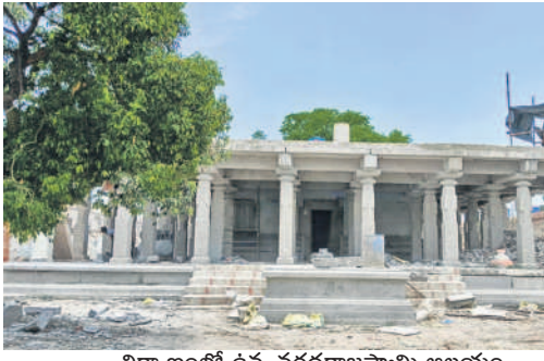
నిర్మాణంలో ఉన్న వరదరాజస్వామి ఆలయం

కేసీఆర్ సందర్శనతో పూర్తి వైభవం కొండపోచమ్మ సాగర్ రిజర్వాయర్ ప్రారంభోత్సవం కోణాన వరదరాజస్వామి ఆలయాన్ని అప్పటి సీఎం కేసీఆర్ దర్శించారు. ఆలయానికి పూర్తివైభవం తీసుకురావాలని సంకల్పించి, అప్పట్లో నిర్మాణ పనులకు రూ.10 కోట్లు మంజూరుచేశారు. గ్రామాలిప్పట్టికి మరో రూ.10 కోట్లు అదనంగా మంజూరు చేశారు. దీంతో వరదరాజస్వామి ఆలయ గోపురం, ముఖద్వారానికి రూ.70 లక్షలు, ఆలయంలోని