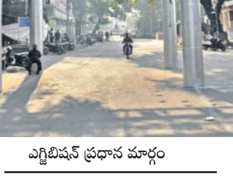
ఎగ్జిబిషన్ ప్రధాన మార్గం

రాష్ట్రంలో మహిళా విద్యా వ్యాప్తికి కృషి ఎగ్జిబిషన్ నిర్వహణ ద్వారా వస్తున్న ఆదాయంతో ఎగ్జిబిషన్ సాఫ్ట్ వేర్ రాష్ట్రంలోని పలు జిల్లాల్లో విద్యా వ్యాప్తికి కృషి చేస్తోంది. ముఖ్యంగా మహిళా విద్యా వ్యాప్తికి గాను మహిళా కళాశాలలు, పాలిటెక్నిక్, పాలిటెక్నిక్, ఇంజనీరింగ్, డిగ్రీ, ఐటీఐ కళాశాలలను స్థాపించింది. పలు జిల్లాల్లో ఎగ్జిబిషన్ ఆధ్వర్యంలో 20 విద్యా సంస్థలు కొనసాగుతున్నాయి. ఏడాది ఆయా విద్యా సంస్థల ద్వారా దాదాపు 30 వేల మంది విద్యార్థులు విద్యనభ్యసిస్తున్నారు.