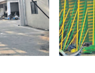
ఎగ్జిబిషన్ లో ఏర్పాటు చేస్తున్న అమ్మకాణి మెంటో పార్క్