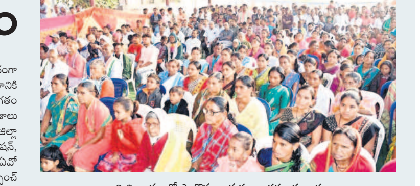
జామినో గ్రామంలో పాల్గొన్న గ్రామస్థులు, దరఖాస్తుదారులు