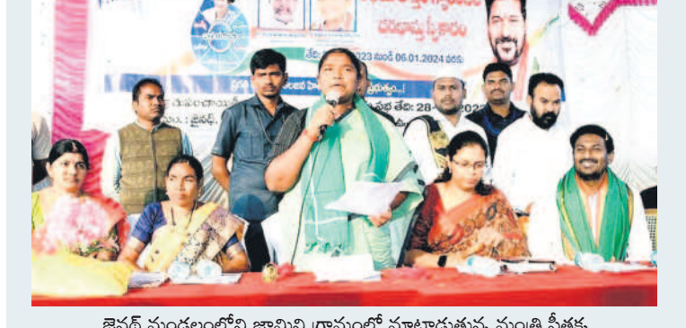
జైసల్ మండలంలోని జామినోల్ గ్రామంలో మాట్లాడుతున్న మంత్రి సీతక్క