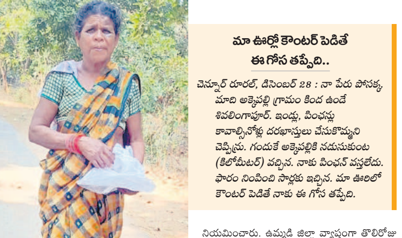
మా ఊర్లో కౌంటర్ పెడితే ఈ గోస తప్పేది..

ప్రతి మండలానికి రెండు బృందాల చొప్పున ప్రజా పాలన దరఖాస్తులు స్వీకరించేందుకు వచ్చారు. ఒక్కో బృందం ఉదయం నుంచి మధ్యాహ్నం వరకు ఒక గ్రామం, మధ్యాహ్నం నుంచి సాయంత్రం వరకు మరో