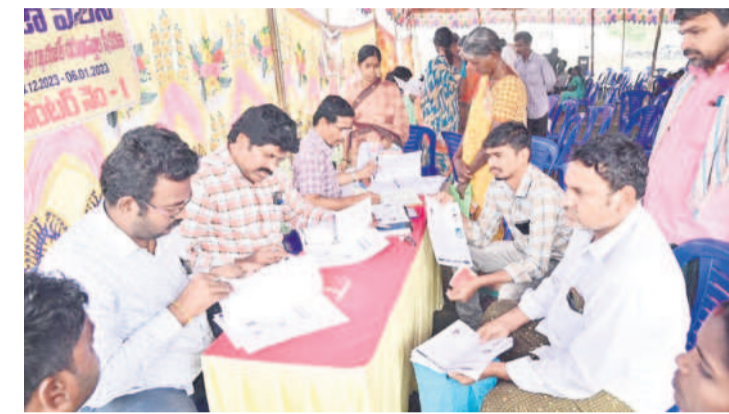
ఖమ్మం రూరల్ మండలంలో ఏర్పాటు చేసిన సభలో దరఖాస్తులు స్వీకరిస్తున్న అధికారులు