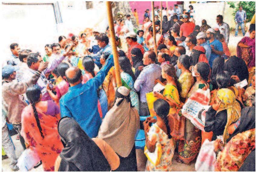
గురువారం వరంగల్ 5వ డివిజన్ కొత్తూరు జెండా ప్రాంతంలో ప్రజాపాలన కార్యక్రమంలో అభయహస్తం దరఖాస్తు పత్రాల కోసం పోటీపడుతున్న ప్రజలు