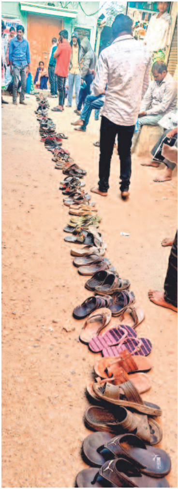
అభయహస్తం దరఖాస్తుల నేపథ్యంలో ఆధార్ అప్డేషన్ కోసం జైంసాలోని మీసేవ కేంద్రం వద్ద చెప్పులు క్యూగా పెట్టిన జనం