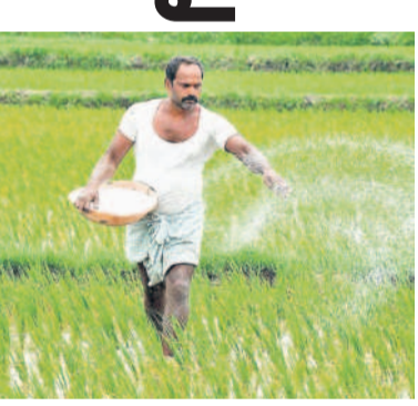
కార్డు లింక్ చేస్తే 7.5 ఎకరాలకే కటాఫ్!

ఉన్నాయి. దీన్ని బట్టి పెట్టుబడి సాయానికి, రేషన్ కార్డుకు లింక్ చేస్తామన్న అనుమానాలు మరింత బలపడుతున్నాయి. సాధారణంగా రైతుసారి సీజన్ల ముందుకు కొత్త రైతులు ఎవరైనా ఉంటే వారి సుందరి ఆయా ఏఈవోలు దరఖాస్తులు స్వీకరించి వారి పేర్లను రైతుబంధు జాబితాలో చేర్చుతారు. కానీ, కాంగ్రెస్ ప్రభుత్వం రైతుభరోసాకు కొత్త రైతుల ఎంపికను ప్రత్యేకంగా రేషన్ కార్డుతో సంబంధం ఉన్నట్లుంటే గ్యాస్ రెషన్ దరఖాస్తులో చేర్పింది. ఇది ఏ మేరకు సక్సెస్ అవుతుందో పరిశీలించాక ఓ నిర్ణయం తీసుకునే అవకాశం ఉన్నదని తెలిసింది.