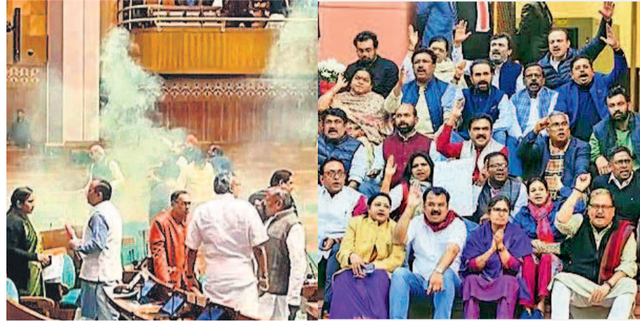
కున్న చిన్నసత్వం ఏమంటే దేశభక్తి అనేది బీజేపీ సొత్తం అని!

పార్లమెంట్పై ఆగంతకుల దాడి చాలా గర్భమైనది. దాడి చేసిన వ్యక్తులు ఆకాశాల్పనే ప్రస్తుతానికి మనకున్న సమాచారం, అంటే వాళ్ళ ఉగ్రవాద సంస్థలకు చెందినవారని దర్యాప్తు సంస్థలు ఇప్పటివరకు నిర్ధారించలేదు. కానీ వాళ్ళ దుస్సాహసాన్ని ఖండించాలి. చట్ట ప్రకారం కఠిన శిక్ష విధించాలి. దాడికి పాల్పడినవారు నిరుద్యోగులు, నిస్సహాయులు లేకపోవడం వల్ల వాళ్ళ చేసిన పనిని తేలికగా చూడకూడదు. వాళ్ళ ఆకాశాలు చేష్టలకు ఏకంగా పార్లమెంటును వేదికగా చేసుకోవడం చూసి సామాన్యులు విస్తుపోయారు.