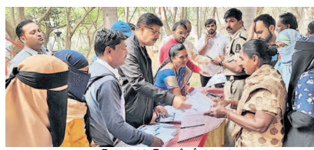
సైదాబాద్ మాదవనగర్ కాలనీలో దరఖాస్తులను అందజేస్తున్న మలక్పేట ఎమ్మెల్యే బలాల