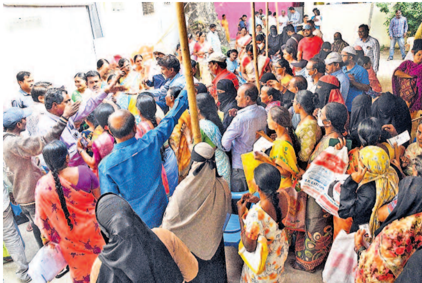
గురువారం వరంగల్ 5వ డివిజన్ కోర్టుకు జెండా ప్రాంతంలో ప్రజాపాలన కార్యక్రమంలో అభయహస్తం దరఖాస్తు పత్రాల కోసం పోటీపడుతున్న ప్రజలు

శుక్రవారం, సూర్యోదయం: 6-45, సూర్యాస్తమయం: 5-51. శ్రీ శోభకర్ నామ సంవత్సరం దక్షిణాయనం హేమంత రుతువు మూడో ర మాసం కృష్ణ పక్షం తిథి: విదియ ఉదయం 7-59 వలకు, తదుపరి తదియ. నక్షత్రం: పుష్యమి రాత్రి 8-10 వలకు. వర్జ్యం: ఉదయం 9-47 నుంచి ఉదయం 11-81 వరకు. రాహుకాలం: ఉదయం 10-54 నుంచి ఉదయం 12-17 వరకు. దుర్భుధాకాలం: ఉదయం 8-58 నుంచి ఉదయం 9-42 వరకు, స్రవణ దుర్భుధాకాలం: పగలు 12-39 నుంచి పగలు 1-24 వరకు. అమృతకాలం: రాత్రి 8-12 నుంచి రాత్రి 9-56 వరకు. పూర్వాషాఢ కాలే.