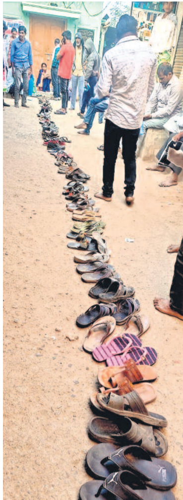
అభయహస్తం దరఖాస్తుల నేపథ్యంలో ఆధార్ అప్డేషన్ కోసం టైంసాలోని మీసేవ కేంద్రం వద్ద చెప్పులు క్యూగా పెట్టిన జనం

శుక్రవారం FRIDAY 29.12.2023 హైదరాబాద్ HYDERABAD పేజీలు: 12+8 Pages: 12+8 వివిధ సంపుటి (Volume): 13 || సంచిక (Issue): 204 || వెల (Price) రూ.6.50