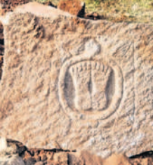
పాలకర్తిలో పద్మశాలి కమ్యూనిటీ హాల్ నిర్మాణ పనుల తవ్వకాల్లో బయటపడిన పురాతన విగ్రహాలు

పాలకర్తి, డిసెంబర్ 28 : మండల కేంద్రంలో పద్మశాలి కమ్యూనిటీ హాల్ నిర్మాణ కోసం చేపట్టిన తవ్వకాల్లో గురువారం పురాతన విగ్రహాలు బయటపడ్డాయి. పిల్లల గుంతలు తవ్వకుండా ఈ విగ్రహాలు బయటపడినట్లు కూలీలు తెలిపారు. రాతిబండ పై రెండు పాదాలతో కూడిన రూపం కలిగి ఉందని పేర్కొన్నారు. పురావస్తుశాఖ అధికారులు ఈ విగ్రహాలను పరిశీలిస్తే ఏ కాలానికి చెందినవో తెలుస్తుందని స్థానికులు తెలిపారు.