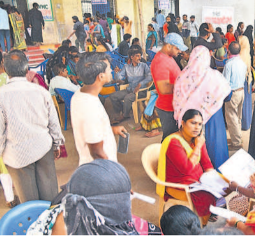
కొత్తూరు జిండా ప్రాంతంలో దరఖాస్తు ఫారాల కోసం వేచి వున్న మహిళలు

లేక అద్దె ఇళ్లలో ఉంటున్నవారు ఎలా దరఖాస్తు చేసుకోవాలి తెలియక అయోమయానికి గురయ్యారు. దీనికోసం కూడా ప్రత్యేకంగా తెల్లకాగితంపై రాసి ఇవ్వడం కనిపించింది. గృహ జ్యోతి పథకంలో 200 యూనిట్ల ఉచిత విద్యుత్ కాలమ్ లో వాడుకనే యూనిట్ల సంఖ్యపైనా అయోమయం నెలకొంది. 200 యూనిట్ల ఉచిత విద్యుత్ అద్దె ఇంట్లో ఉండేవారికి ఎలా వర్తిస్తుందో తెలియక గందరగోళం నెలకొంది. ఒకే దరఖాస్తుతో ఆధార్, రేషన్ కార్డు జిరాక్స్ ఇవ్వచ్చని చెప్పి కొంటర్ పద్దులు వెళ్లిన వారికి తెల్లకాగితంపై రాసిచ్చే దరఖాస్తుకు అదనంగా జిరాక్స్ ప్రతులు అడగడంతో జిరాక్స్ సెంటర్లకు ప్రజలు పరుగులు తీయడం కనిపించింది.