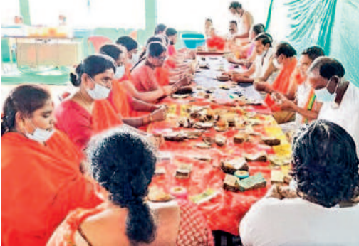
హుందల ఆదాయాన్ని లెక్కిస్తున్న నిబ్బంది