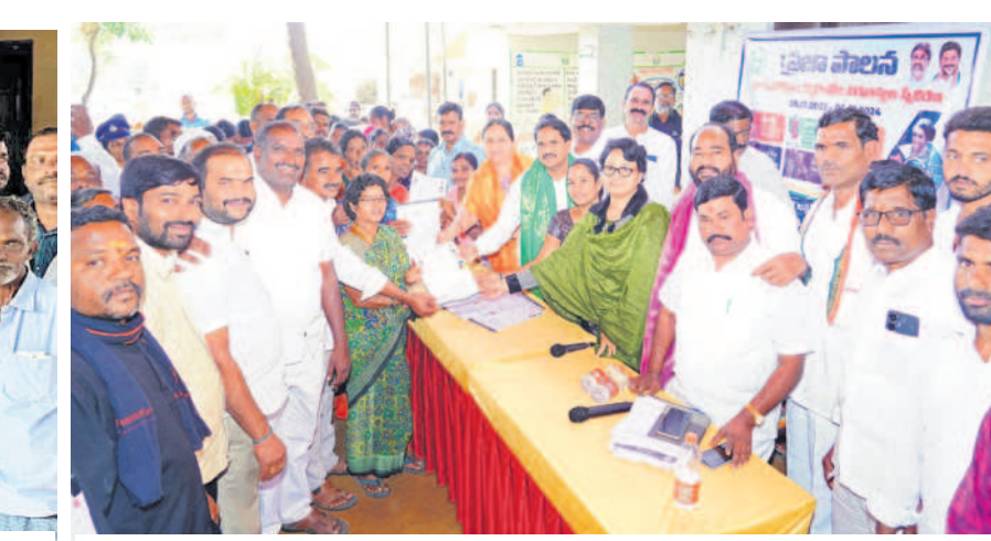
కద్దూర్ : మక్తూబాబాద్ గ్రామంలో ఆరు గ్యారెంజీల దరఖాస్తులను స్వీకరిస్తున్న కల్వకుర్తి ఎమ్మెల్యే నారాయణరెడ్డి