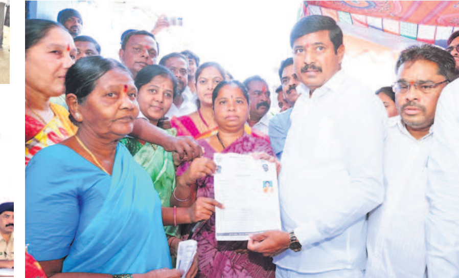
తాండూరు : మున్సిపల్ లోని 2వ వార్డులో మహిళా నుంచి దరఖాస్తు స్వీకరిస్తున్న తాండూరు ఎమ్మెల్యే మహారెడ్డి