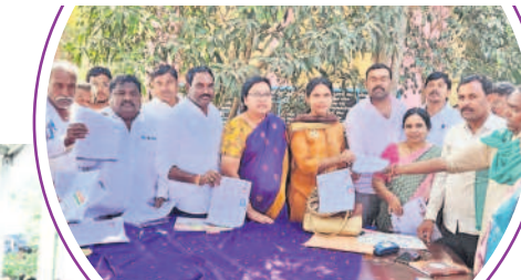
అబ్దుల్లాపూర్ మేట్ లో జరిగిన కార్యక్రమానికి హాజరైన ప్రజలు