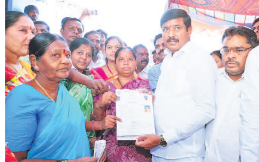
తాండూరు: మున్సిపల్ లోని 2వ వార్డులో మహిళా నుంచి దరఖాస్తు స్వీకరిస్తున్న తాండూరు ఎమ్మెల్యే మహారెడ్డి