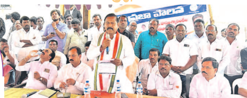
పరిగి దొంగ : ప్రజా పాలన సభలో ప్రజలనుద్దేశించి మాట్లాడుతున్న పరిగి ఎమ్మెల్యే రామోహనరెడ్డి