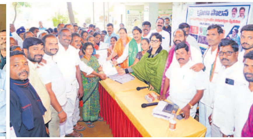
కద్దూర్: మక్తూబాబాద్ గ్రామంలో ఆరు గ్యారెంజీల దరఖాస్తులను స్వీకరిస్తున్న కల్వకుర్తి ఎమ్మెల్యే నారాయణరెడ్డి