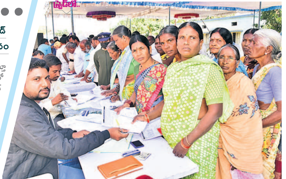
వికారాబాద్ : అధికారులకు ప్రజాపాలన దరఖాస్తులను సమర్పిస్తున్న మహిళలు