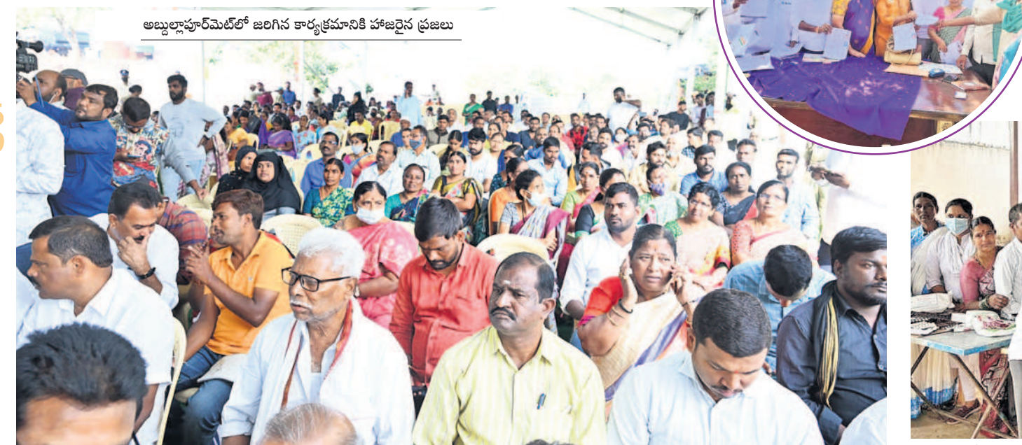
అబ్దుల్లాపూర్ మేట్ లో జరిగిన కార్యక్రమానికి హాజరైన ప్రజలు

ప్రభుత్వం ఎంతో ప్రతిష్టాత్మకంగా చేపట్టిన ప్రజాపాలన కార్యక్రమం వికారాబాద్ జిల్లాలో గురువారం ప్రారంభమైనది. సెలవు దినాల్లో మినహా జనవరి 6వ తేదీ వరకు ప్రజల నుంచి దరఖాస్తులను అధికారులు స్వీకరించున్నారు. జిల్లాలో అర్హులకు ప్రభుత్వ పథకాలను అందించేందుకు ఏర్పాటు చేసిన గ్రామసభలను ప్రజలు సూచించారు. కుటుంబం నుంచి ఒకరు వచ్చి దరఖాస్తు ఇస్తే సరిపోతుందన్నారు.