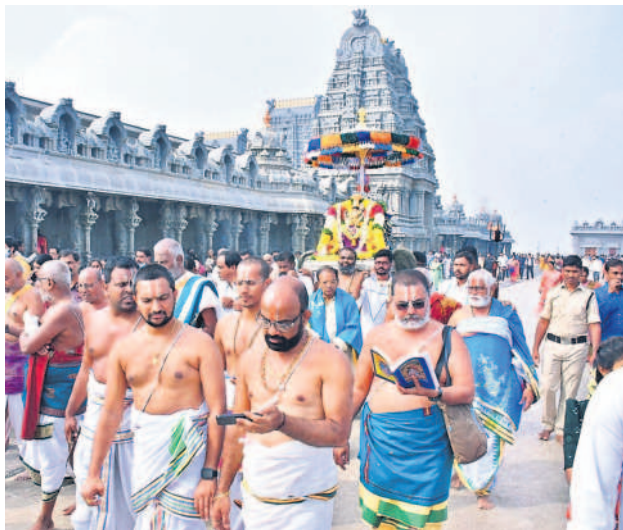
యాదగిరిగుట్ట ఆలయ తిరువీధుల్లో స్వామివారి ఊరేగింపు