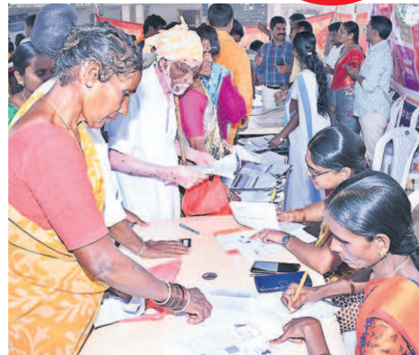
చౌటుప్పల్ మండలం లింగారెడ్డిగూడెంలో ప్రజల నుంచి దరఖాస్తులు స్వీకరిస్తున్న అధికారులు

ప్రజలకు అవగాహన, ప్రచారం కల్పించని యంత్రాంగం దరఖాస్తులకు జనం నుంచి స్పందన అంతంతే.. అఫ్లికేషన్ కౌంటర్ల వద్ద కనిపించని రద్దీ హాజరైన ప్రభుత్వ విప్ అయిలయ్య, ఎమ్మెల్యేలు కుంభం, వేముల