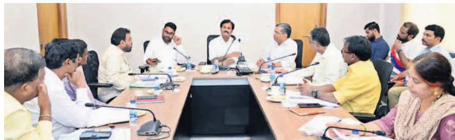
కలెక్టరేట్ లో అధికారులతో మాట్లాడుతున్న ఎమ్మెల్యే కుంభం అనిల్ కుమార్ రెడ్డి