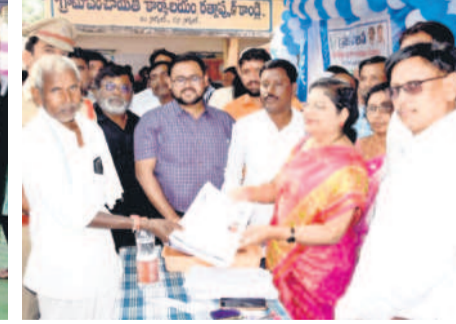
రత్నాపూర్ కాండ్రిలో ఆర్జియూ సర్వేలను..