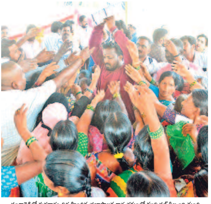
సంగారెడ్డిలో శుక్రవారం నిర్వహించిన ప్రజాపాటు కార్యక్రమంలో మున్సిపల్ సిబ్బంది నుంచి ఆరు గ్యారంటీల దరఖాస్తు పత్రాల కోసం పోటీపడుతున్న ప్రజలు

తుమ్మిడిహట్టి కట్టి తీరుతం రీడిజైన్ తో పాతచోటి బరాజ్ నిర్మిస్తాం ప్రాజెక్టు-చేవేళ్ల ప్రాజెక్టు కొనసాగిస్తాం మేడిగడ్డపై న్యాయవిచారణ జరిపిస్తాం పాలమూరు-రంగారెడ్డికి జాతీయ హోదా ఇవ్వాలని కేంద్రప్రభుత్వాన్ని కోరుతాం ఇంగ్లీషు మంత్రి ఉత్తమకుమార్ రెడ్డి వెల్లడి నలుగురు మంత్రులతో మేడిగడ్డ పరిశీలన బరాజ్ స్థితిపై పవర్ పాయింట్ ప్రజెంటేషన్ > 2