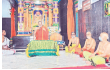
ప్రవచనాలు చెబుతున్న త్రిండది దేవనాద రామానుజ జీయర్ స్వామి

ఖమ్మం, డిసెంబర్ 29 : ధనుర్మాసం అంటే.. దివ్య ప్రార్థనకు అనువైన మాసమని శ్రీశ్రీ శ్రీ త్రిండది దేవనాద రామానుజ జీయర్ స్వామి అన్నారు. ధనుర్మాసం పర్యటనలో భాగంగా శుభ్రచరమ ఖమ్మం కమాన్ బజార్ శ్రీవేంకటేశ్వరస్వామి ఆలయాన్ని దర్శించుకున్న ఆయన జడ్పీ సెంటర్ పోలీస్ వద్ద ధనుర్మాసం ప్రత్యేక గురించి వివరించారు. ధనుర్మాసం పుణ్యకాలంలో ఒక రోజు విష్ణుమూర్తిని పూజిస్తే వెయ్యేళ్లు విష్ణువును భక్తితో పూజించినట్లే అవుతుంది. ధను అనగా.. దేని కొరకు ప్రార్థించడమో అనే అర్థం దృష్ట్యా ధనుర్మాసం అత్యంత పుణ్య కాలమని వివరించారు. ధనుర్మాసం తెలుగు సంస్కృతిలో ఒక భాగమని, దేవాలయాలలో జరిగే అగమ విహిత కైంకర్యాలలో స్వామికి ఆహార వ్యవహారాలు, భజన సంప్రదాయాల కనిగిలినీ అంతాగిస్తే ధనుర్మాసం ఒకటని పేర్కొన్నారు. తిరుమలలో ధనుర్మాసం నెల రోజులపాటు సుప్రభాతం బదులు తిరుమల వైపునే గానం చేస్తారని, సమాప్తమార్చనలో