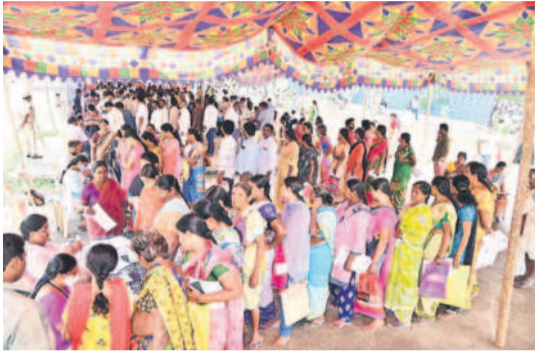
దరఖాస్తులు అందించేందుకు భారీగా కూకట్లన ప్రజలు

ఖమ్మం, డిసెంబర్ 29 (నమస్తే తెలంగాణ ప్రతినిధి) : ఉమ్మడి ఖమ్మం జిల్లావ్యాప్తంగా రెండురోజు శుభ్రచరమా ప్రజాపాలన గ్రామ సభలు జరిగాయి. అధికారులు 21 మండలాల పరిధిలోని 84 గ్రామాలలో సభలు