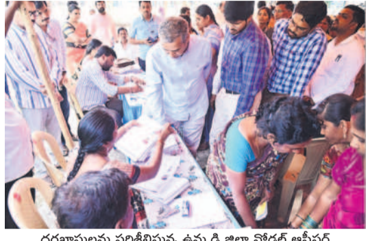
దరఖాస్తులు పరిశీలిస్తున్న ఉమ్మడి జిల్లా నోడల్ ఆఫీసర్

ఖమ్మం, డిసెంబర్ 29 (నమస్తే తెలంగాణ ప్రతినిధి) : ఉమ్మడి ఖమ్మం జిల్లావ్యాప్తంగా రెండురోజు శుభ్రచరమా ప్రజాపాలన గ్రామ సభలు జరిగాయి. అధికారులు 21 మండలాల పరిధిలోని 84 గ్రామాలలో సభలు