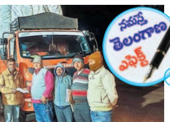
చెరాగపల్లి 65వ జాతీయ రహదారిపై ఏర్పాటు చేసిన చెక్ పోస్టు వద్ద పన్నులు వసూలు చేస్తున్న ఇబ్బంది

జూబిలీహిల్స్, డిసెంబర్ 29 : పత్తి వ్యాపారుల మాయాజాలంతో రైతులు తీవ్రంగా నష్టపోతున్నారని ఈ నెల 23న 'నమస్తే తెలంగాణ'లో 'పత్తి వ్యాపారుల మాయాజాలం' అనే వార్త ప్రచురితం కాగా, జిల్లా అధికారులు వెంటనే స్పందించిన మార్కెట్ లైసెన్స్ లు లేని వ్యాపారులను గుర్తించి నోటీసులు జారీ చేశారు. రాష్ట్ర సరిహద్దుల్లో చెక్ పోస్టు