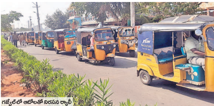
గజ్వేల్లో ఆటోలతో నిరసన ర్యాలీ