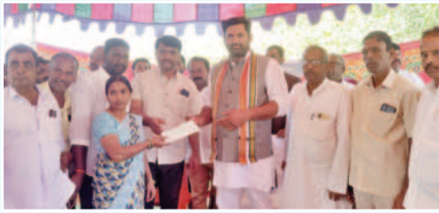
లబ్ధిదారులకు చెక్కులను అందజేస్తున్న ఎమ్మెల్యే మధుసూదన్ రెడ్డి

జడ్చర్లలో, డిసెంబర్ 29 : లబ్ధిదారులకు చెక్కులను అందజేస్తున్న ఎమ్మెల్యే మధుసూదన్ రెడ్డి