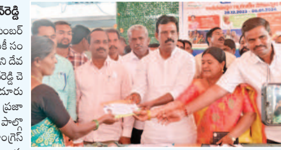
కల్యాణలక్ష్మి చెక్కులను అందజేస్తున్న ఎమ్మెల్యే మధుసూదన్ రెడ్డి

డిసెంబర్ 29 : లబ్ధిదారులకు చెక్కులను అందజేస్తున్న ఎమ్మెల్యే మధుసూదన్ రెడ్డి