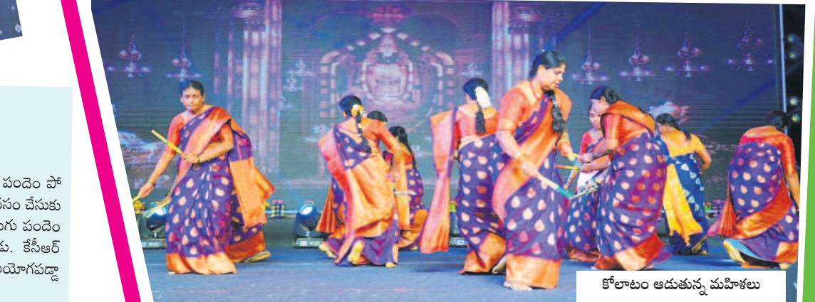
కోలాటం ఆడుతున్న మహిళలు