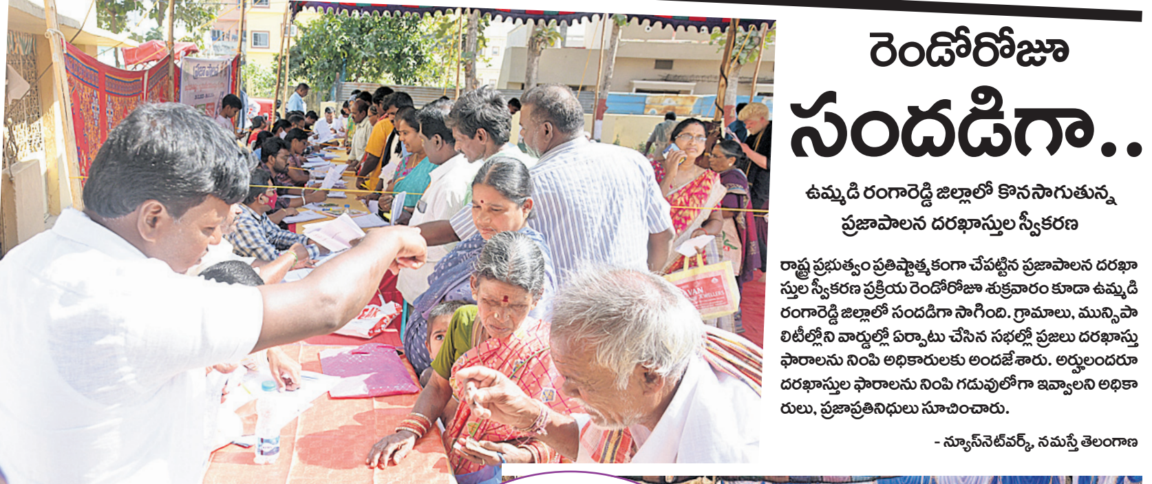
శంకరపల్లి : మోకలలో ప్రజల నుంచి దరఖాస్తులు తీసుకుంటున్న అధికారులు