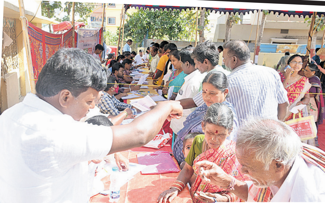
శంకరపల్లి : మోకలలో ప్రజల నుంచి దరఖాస్తులు తీసుకుంటున్న అధికారులు