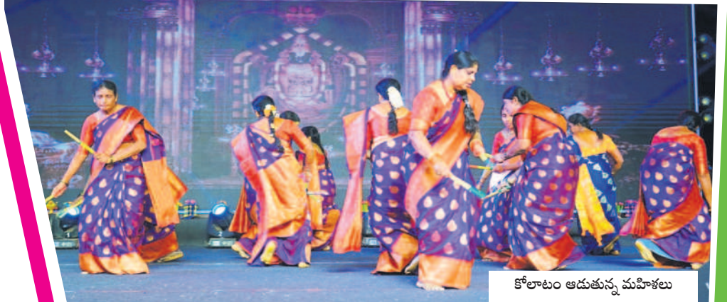
కోలాటం ఆడుతున్న మహిళలు