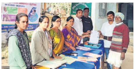
రామాయంపేట రూరల్ : శివాయిపల్లిలో దరఖాస్తుల స్వీకరణ