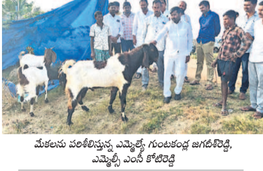
మేకలను పరిశీలిస్తున్న ఎమ్మెల్యే గుంటకండ్ల జగదీశ్వర్, ఎమ్మెల్యే ఎంసీ కోటిరెడ్డి