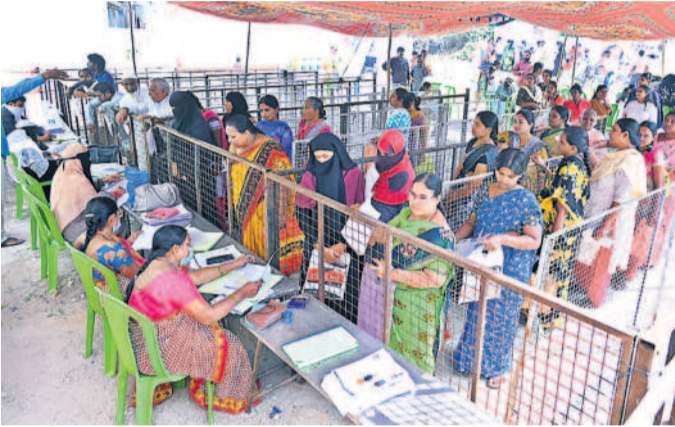
సూర్యాపేటలోని భగవీనిగ సగరలో ప్రజాపాలన దరఖాస్తులు స్వీకరిస్తున్న అధికారులు

నల్లగొండ, డిసెంబర్ 29 : ప్రజాపాలన కార్యక్రమంలో వివిధ పథకాల కోసం దరఖాస్తులు అంతత మాత్రంగానే వచ్చాయి. తొలి రోజు మాదిరిగానే ప్రజలకు సమస్యలు ఎదురయ్యాయి. అధికారులు, సిబ్బంది సరైన అవగాహన కల్పించకపోవడం, దరఖాస్తు ఫారాలు నింపడంలో కొంత ఇబ్బంది పడ్డారు. జిల్లా వ్యాప్తంగా శుక్రవారం 116 గ్రామ పంచాయతీలతో పాటు 58 మున్సిపల్ వార్డుల నుంచి దరఖాస్తుల స్వీకరణ జరిగింది. 53,844 కుటుంబాలకు దరఖాస్తు ఫారాలు ఇవ్వగా 37,750 కుటుంబాలు దరఖాస్తు చేసుకున్నాయి. ఇప్పటి వరకు ఈ రెండు రోజుల్లో