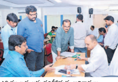
ఎన్నికల ఖర్చులను పరిశీలిస్తున్న అధికారులు