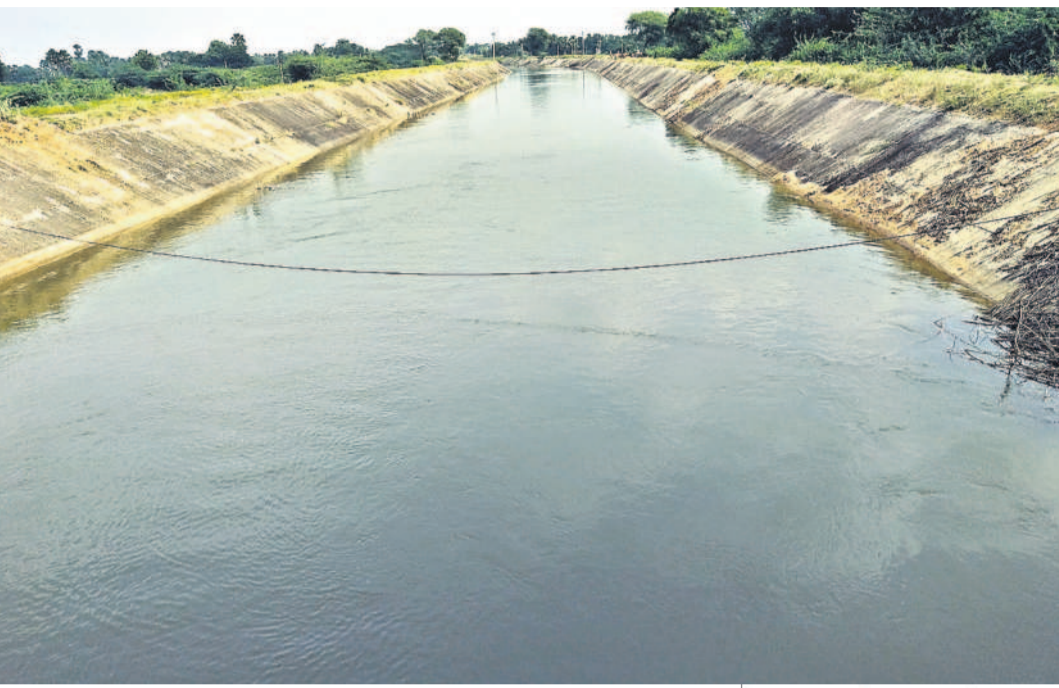
నాగారం మండలం ప్రగతినిగర్ వద్ద ప్రవహిస్తున్న కాశేశ్వరం జిల్లా (ఘేట్)

యాసంగి పంటల సాగు కోసం కాశేశ్వరం జిల్లాలను వారబంది వద్దతిలో విడుదల చేయనున్నారు. సూర్యాపేట జిల్లాలో జనవరి 8నుంచి మార్చి 30వ తేదీ వరకు కొనసాగే నీటి విడుదల షెడ్యూల్ను శుక్రవారం నీటి పారుదల శాఖ అధికారులు వెల్లడించారు. రోజుకు 4వేల క్యూసెక్కుల చొప్పున 6 ఏడు తల్లో 48రోజులు నీటి విడుదల చేయనున్నారు. ఆరుతడి పంటలకు ప్రాధాన్యం ఇవ్వాలని, నీటిని పొందుతున్న వాడుకోవాలని అధికారులు రైతులకు సూచించారు. గతేడాది యాసంగి సాగుకు ప్రభుత్వం జనవరి 8నుంచి ఏప్రిల్ 15వరకు 58రోజులపాటు సాగునీరు అందించింది.