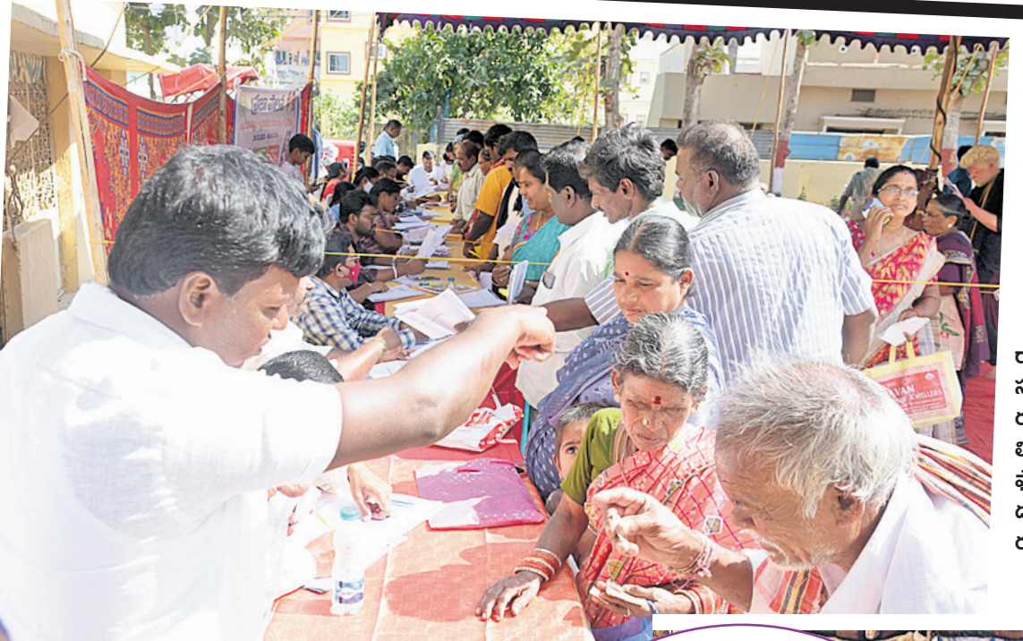
శంకరపల్లి : మోకలలో ప్రజల నుంచి దరఖాస్తులు తీసుకుంటున్న అధికారులు