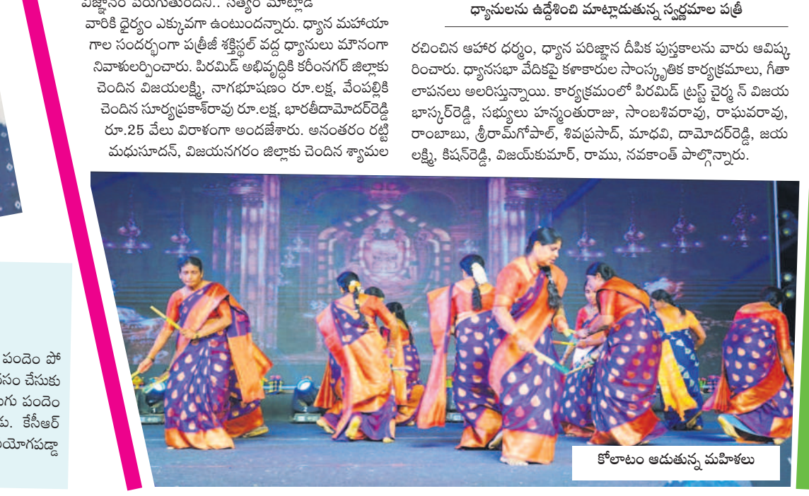
కోలాటం ఆడుతున్న మహిళలు